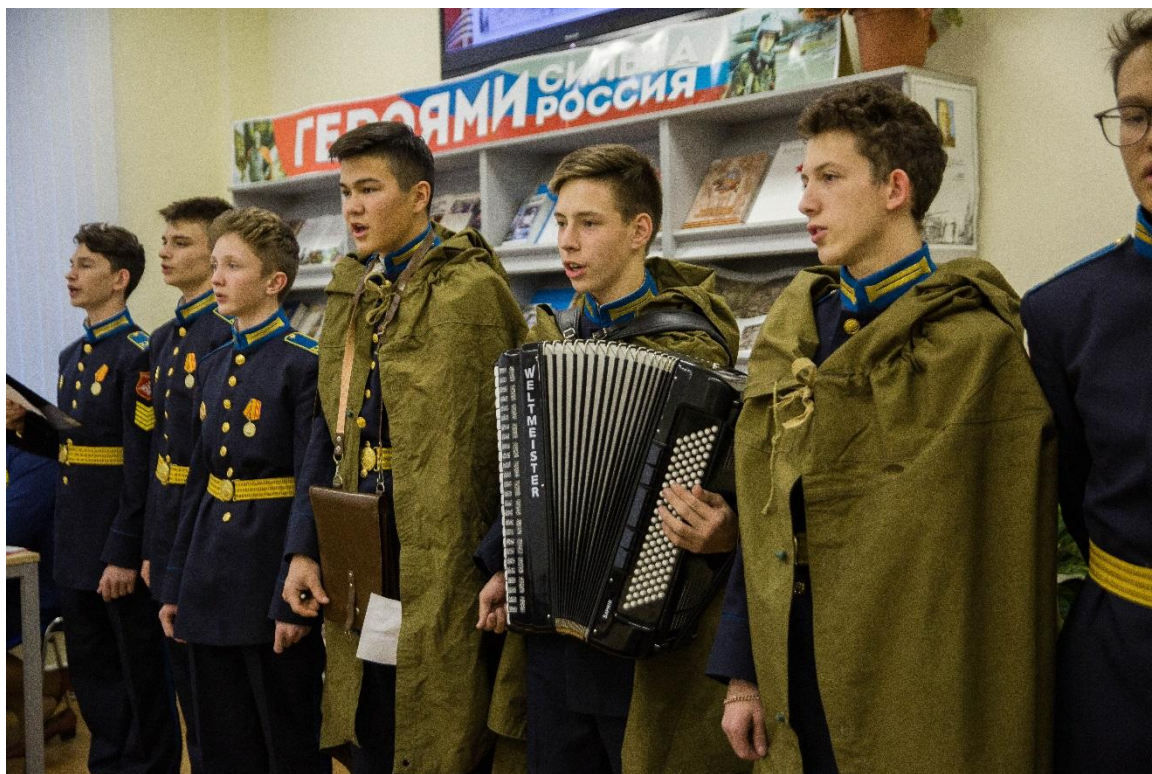
Исполнение песни «Три танкиста»