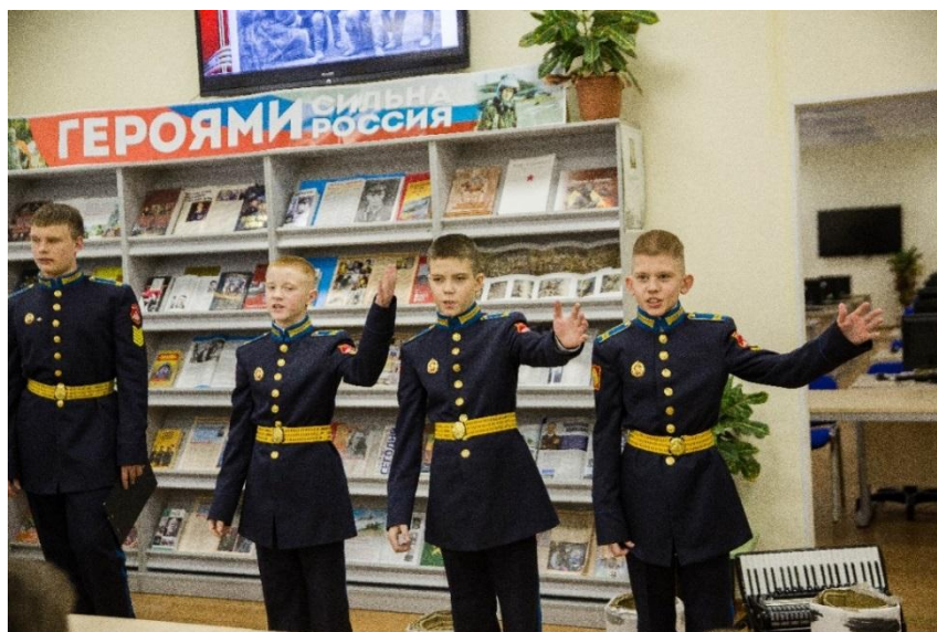
Группа кадет 5 класса исполняет частушки