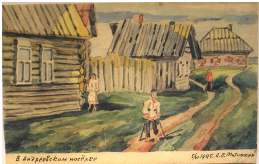
Митинский А. П. «В Андреевском поселке»