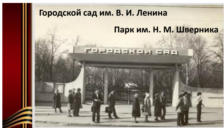
Городской сад им. В. И. Ленина

В эти годы в Тюмени проходили творческие встречи с известными актерами, летом для демонстрации фильмов и постановке спектаклей использовались открытые площадки в парках отдыха.