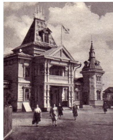
Тобольский драматический театр им. П. П. Ершова

Кроме Тюменского и Тобольского театров, были еще театры в г. Ишиме, г. Салехарде, г. Ялуторовске.