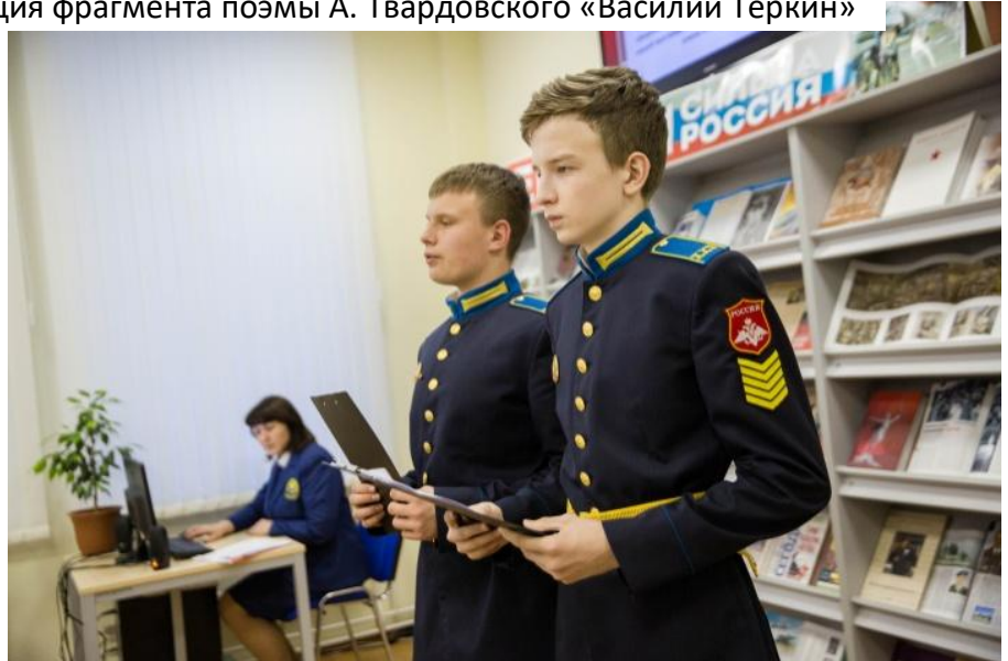
Ведущие читают текст