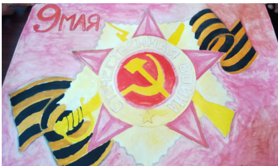
Рисунок студентов группы АМ-2-9а