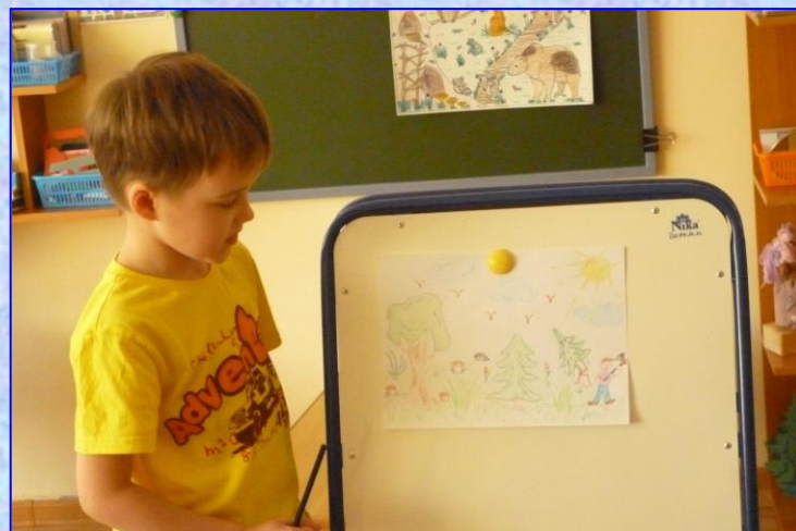
Ян Т. «Сказка о том, как звери ёлочку спасли»