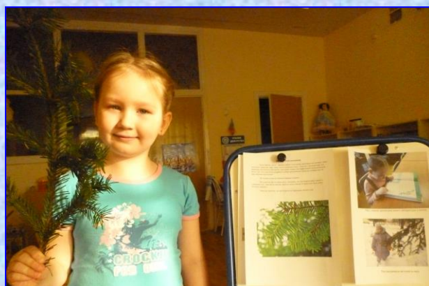
Даша о пихте