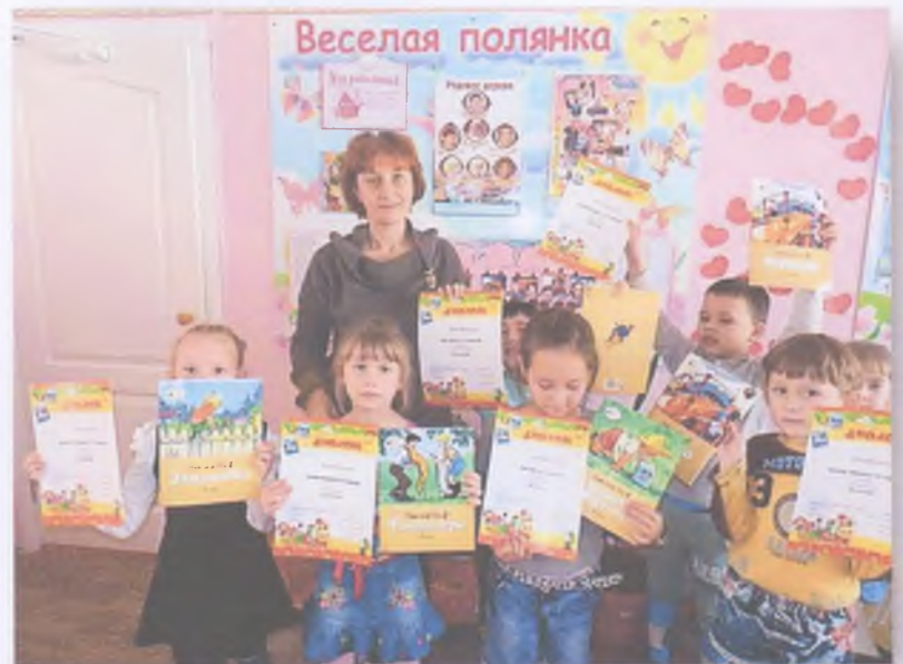
Участники проекта получили Дипломы и памятные подарки