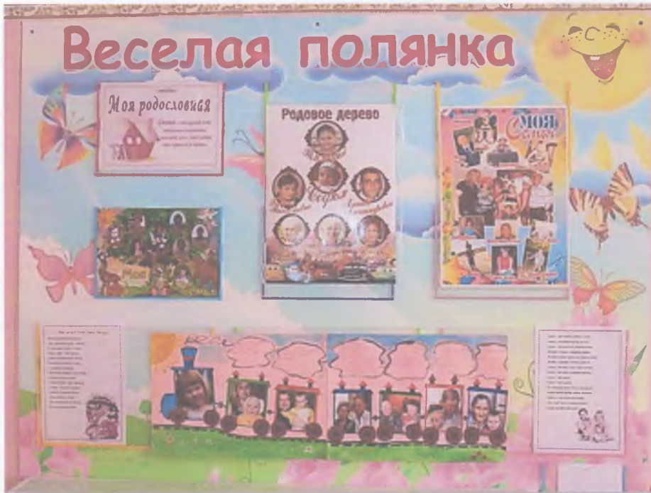
Работы участников творческого проекта «Моя родословная»