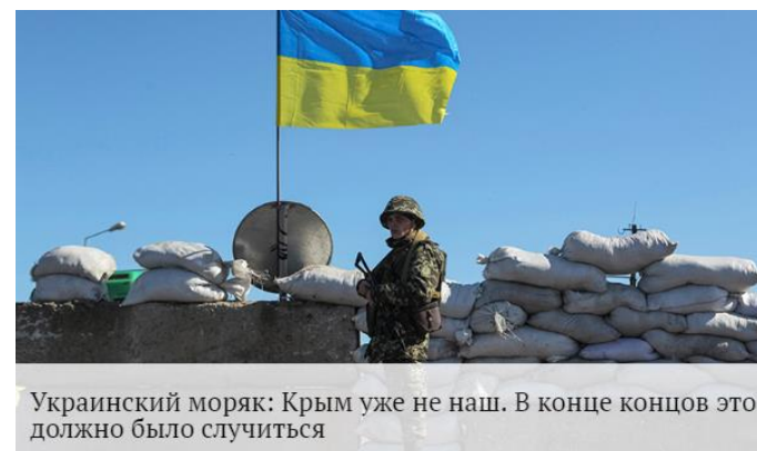
Украинский моряк: Крым уже не наш. В конце концов это должно было случиться

В Севастополе вооружённые люди в камуфляже без знаков различия блокируют штаб ВМС Украины, здание оказывается обесточенным. Также блокируется 36-я бригада береговых войск ВС Украины, дислоцирующаяся в селе Перевальном. К вечеру бескровно захватываются штабы Азово-Черноморского регионального управления и Симферопольского пограничного отряда Погранслужбы Украины, устанавливается контроль над одним из украинских дивизионов ПВО в районе мыса Фиолент.