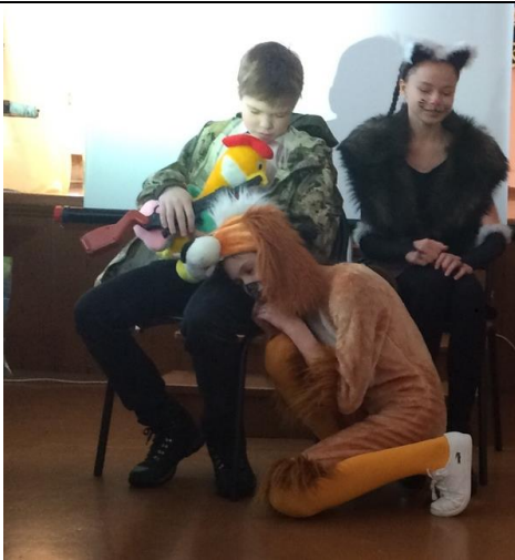
«Собака, человек, и кошка, и сокол»