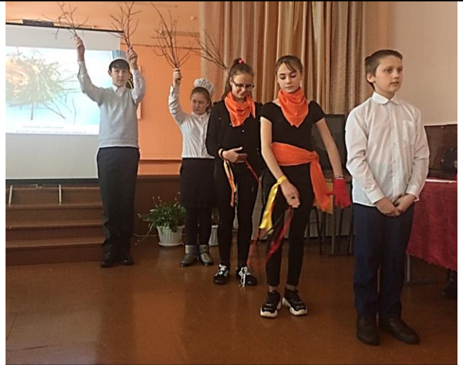
«Роца и Огонь»