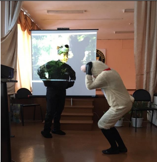
«Волк и Ягненок»