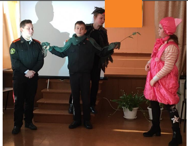
«Свинья под дубом»