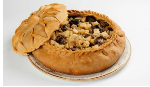
Бэлиш - печеный пирог начиненный мясом с картофелем, рисом или пшеном.