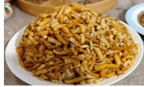
Чак-чак — сладкое изделие из теста с медом.