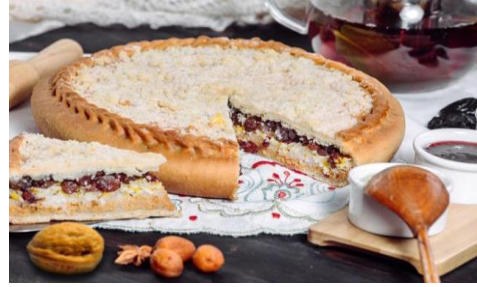
Губадия — закрытый пирог со сладкой начинкой (рис, сухофрукты, творог)