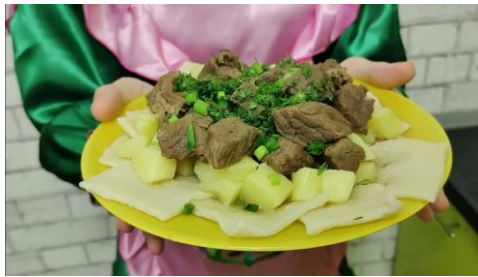
Беибармак — тушеное мясо с домашней лапшой.