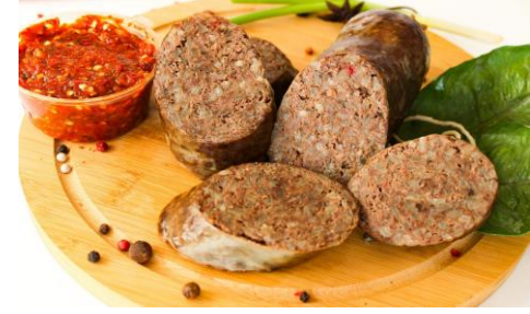
Путырма - домашняя колбаса из кишки, начиненная рубленным мясом с рисом.