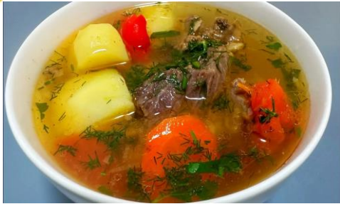
Шурпа - жирный, густой суп на основе баранины.