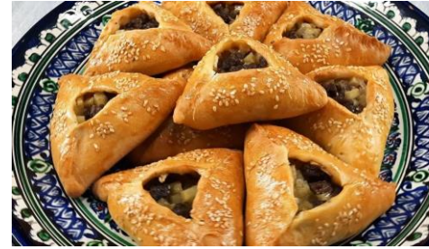
Жигочмак - традиционное татарское национальное блюдо, пирожки в форме треугольников.