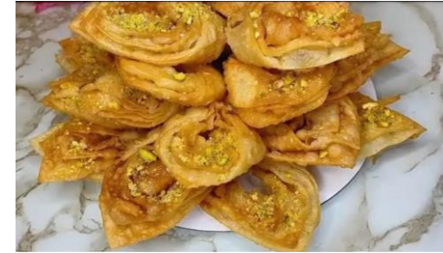
Пахлава - печенье из слоеного теста с орехами в сиропе.