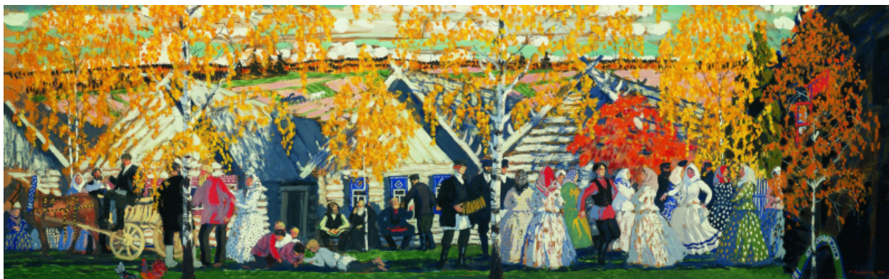
Рис.3. Кустодиев Б. «Деревенский праздник» (1910)

яркую сцену народного гулянья, где праздничная толпа, пляшущие крестьяне и нарядные дома сливаются в единый мажорный хоровод, прославляющий изобилие и жизнерадостность русской провинции.