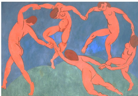
Рис.1. Анри Матисс, «Танец» (1910)

Картина «Танец» Анри Матисса - это динамичная и экспрессивная композиция, в которой пять обнажённых фигур, изображённых звучными пятнами чистого цвета (красного на фоне зелёного и синего), сцепив руки, движутся в вихревом хороводе, передавая первобытную радость, энергетику и ритм жизни.