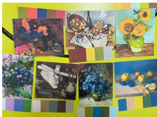
Приложение №2 д/и «Подбери