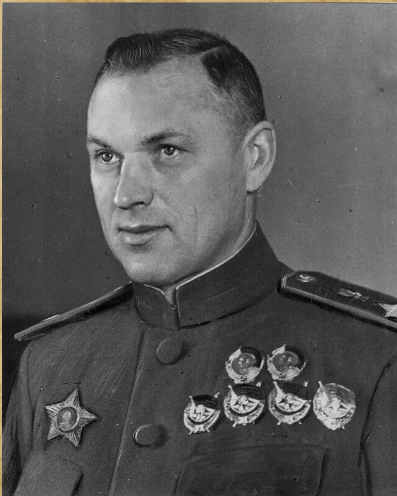
1 генерал армии К.К. Рокоссовский 9 (21) декабря 1896 – 3 августа 1968