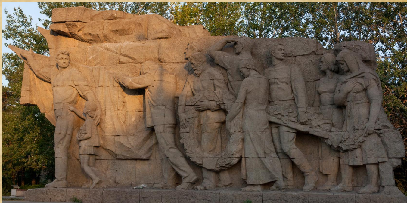
Горельеф «Память поколений»