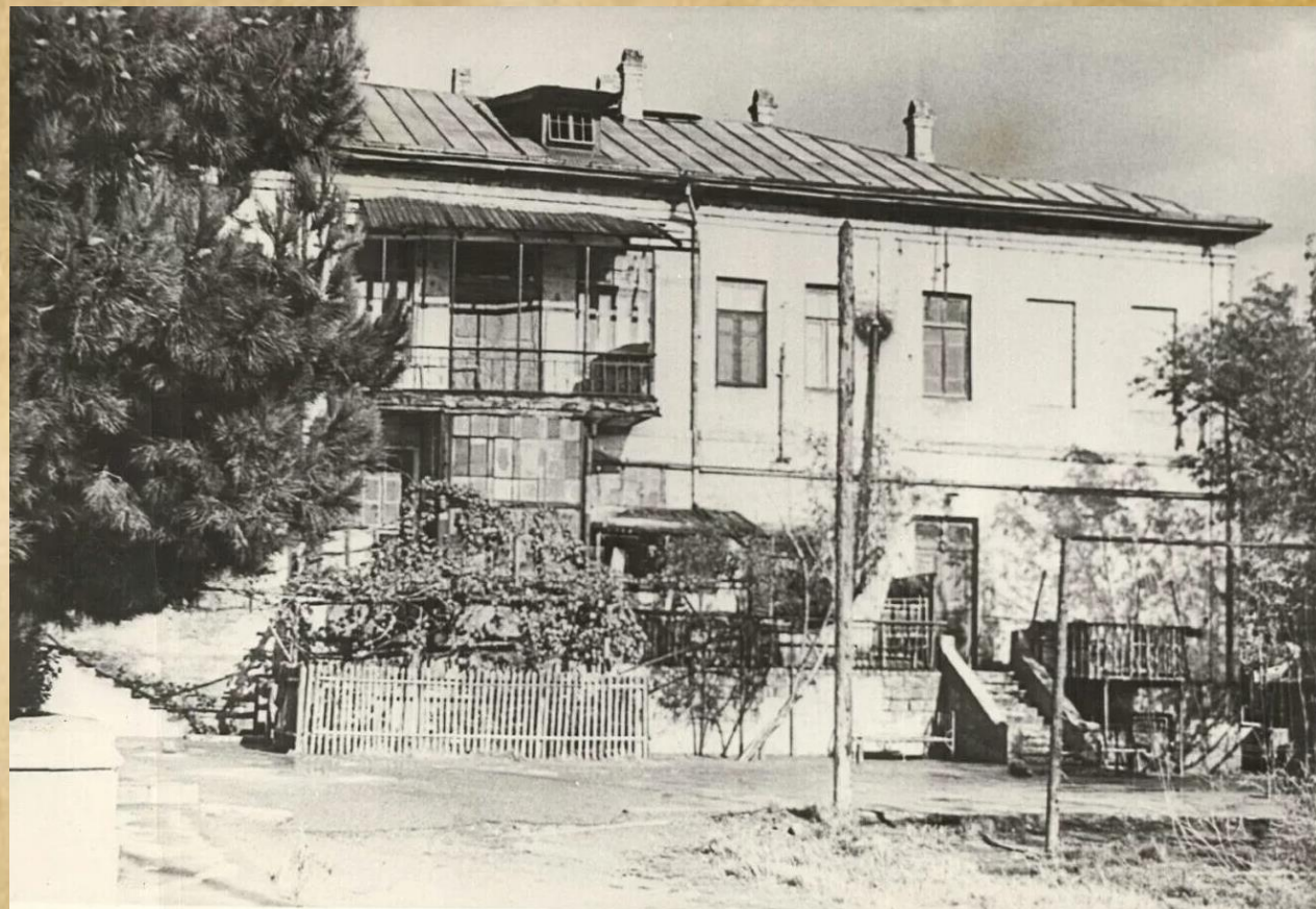
Дом Рихарда Зорге