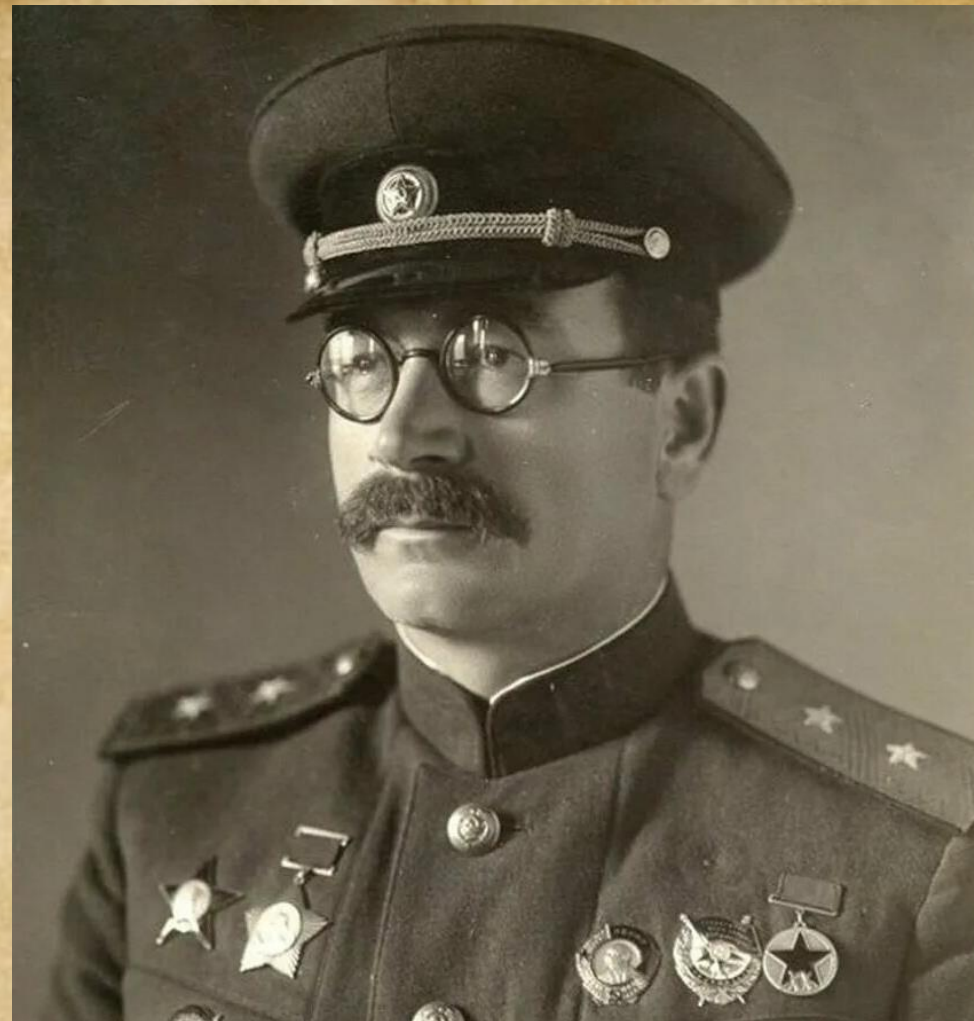
2 генерал-лейтенант П.А. Ротмистров 23 июня (6 июля) 1901 – 6 апреля 1982