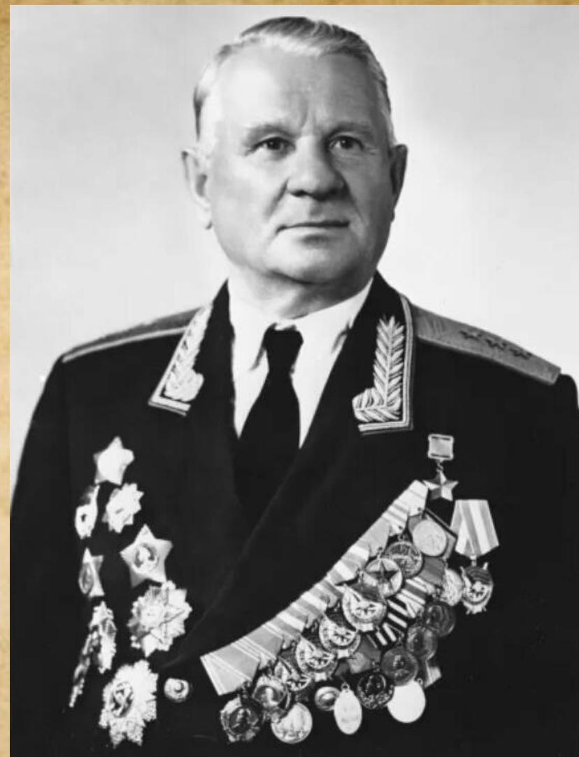
Генерал-лейтенант И.М. Чистяков