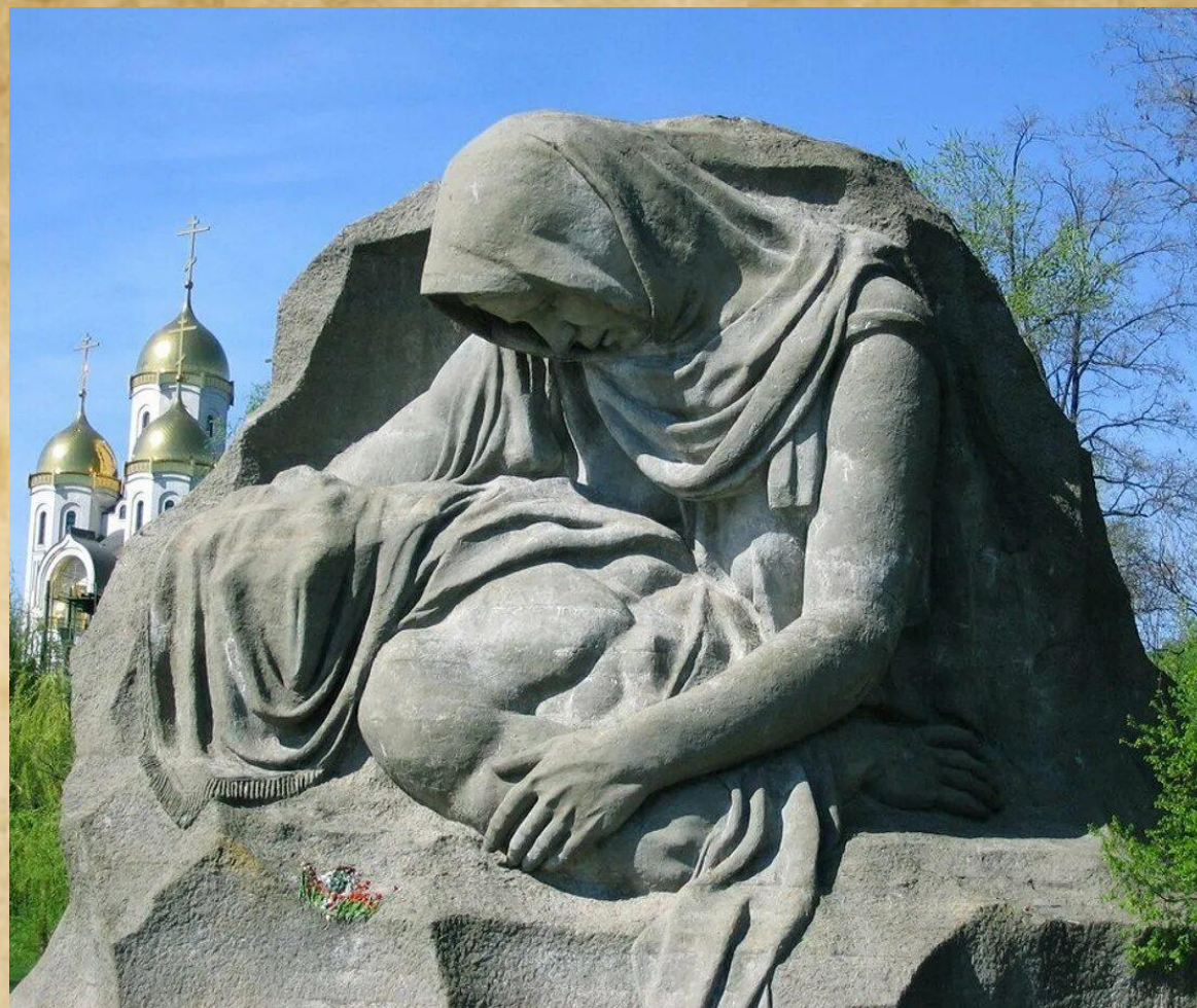
Скульптура «Скорбящая мать»