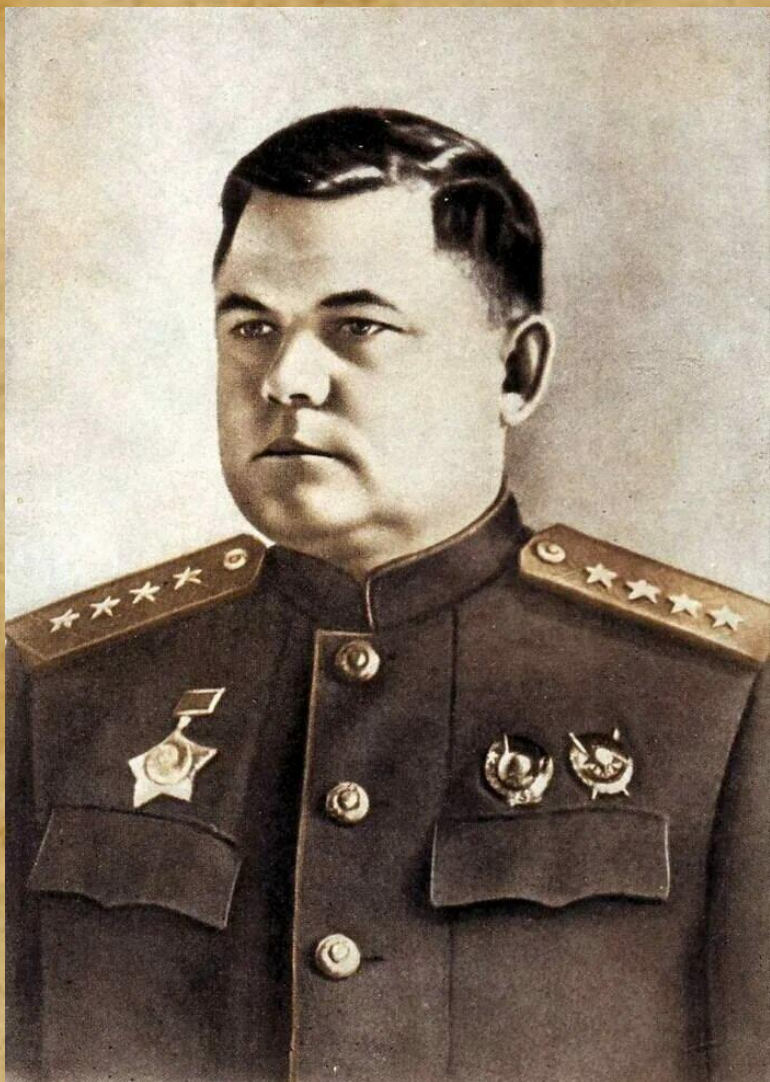
Генерал армии Н.Ф. Ватутин