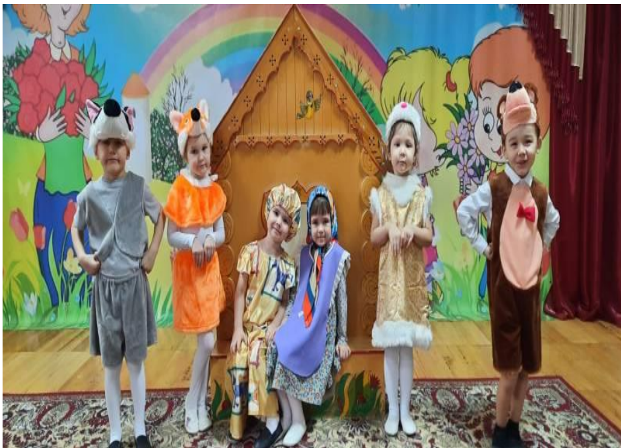
Сказка «Теремок», «Колобок»