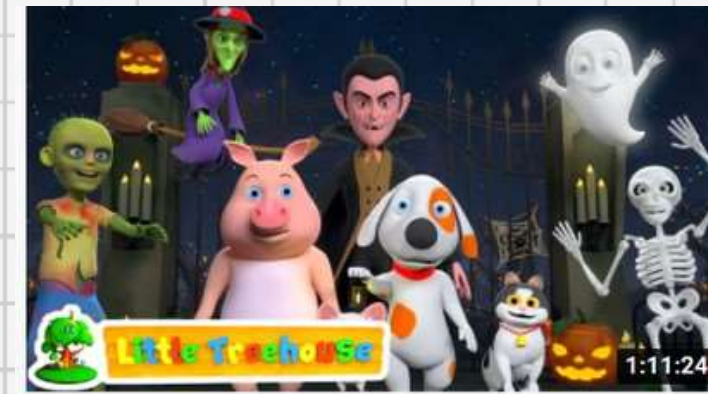
HALLOWEEN VIDEOS FOR KIDS СЕЗОН 1 • СЕРИЯ 6 Halloween Songs | Kindergarten Nursery Rhymes by Little Treehouse