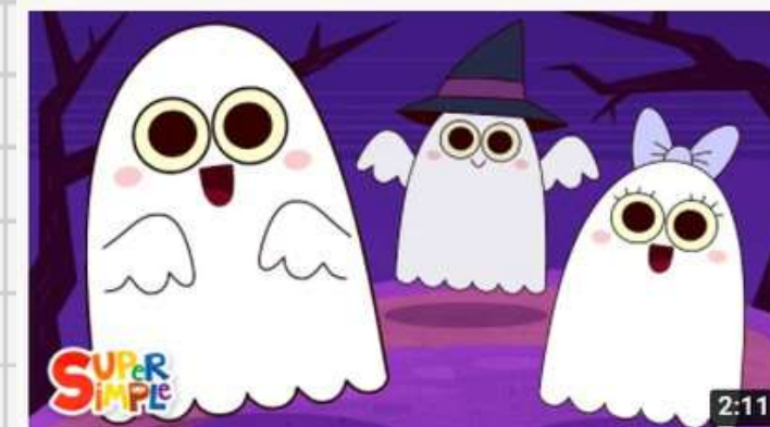
KIDS HALLOWEEN SONGS FROM SUPER SIMPLE SONGS Five Little Ghosts | Halloween Song for Kids 36 млн просмотров • 1 год назад