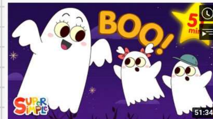
Five Little Ghosts | + More Halloween Songs 5,9 млн просмотров • 2 месяца назад