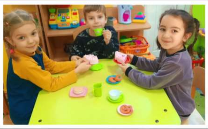
Сюжетно-ролевая игра «Семейное чаепитие»