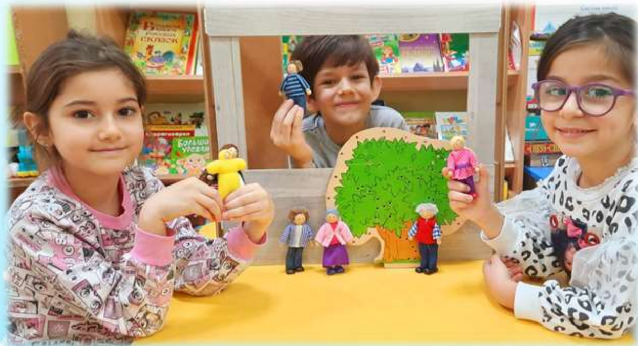
Театрализованная игра «Семья»