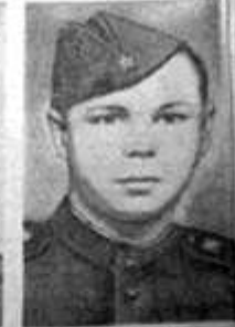
А. Ф. Кривошеин