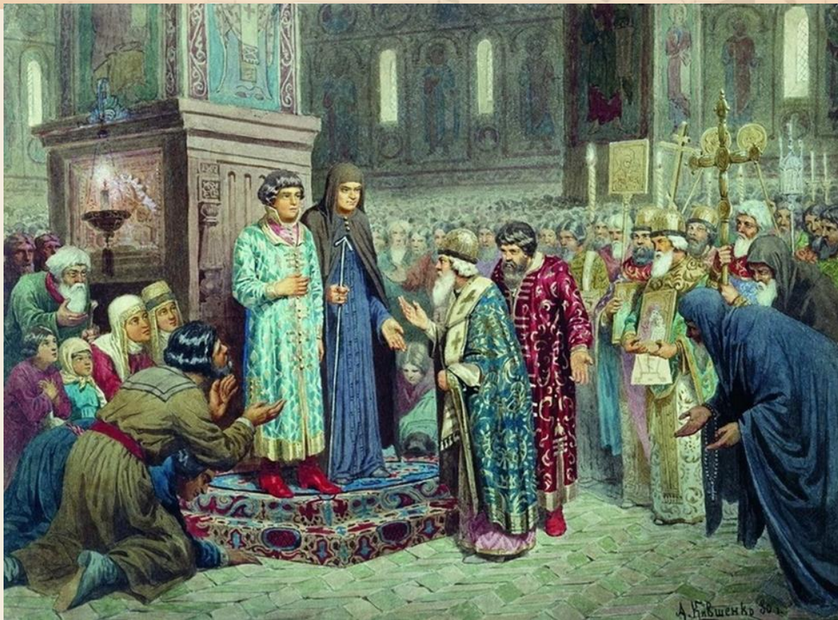
3 марта 1613 года Земский собор избрал Михаила Романова новым царем.