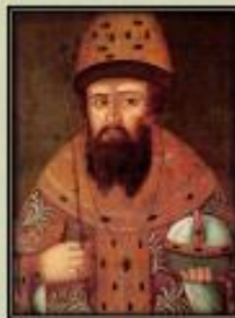
Михаил Фёдорович Романов