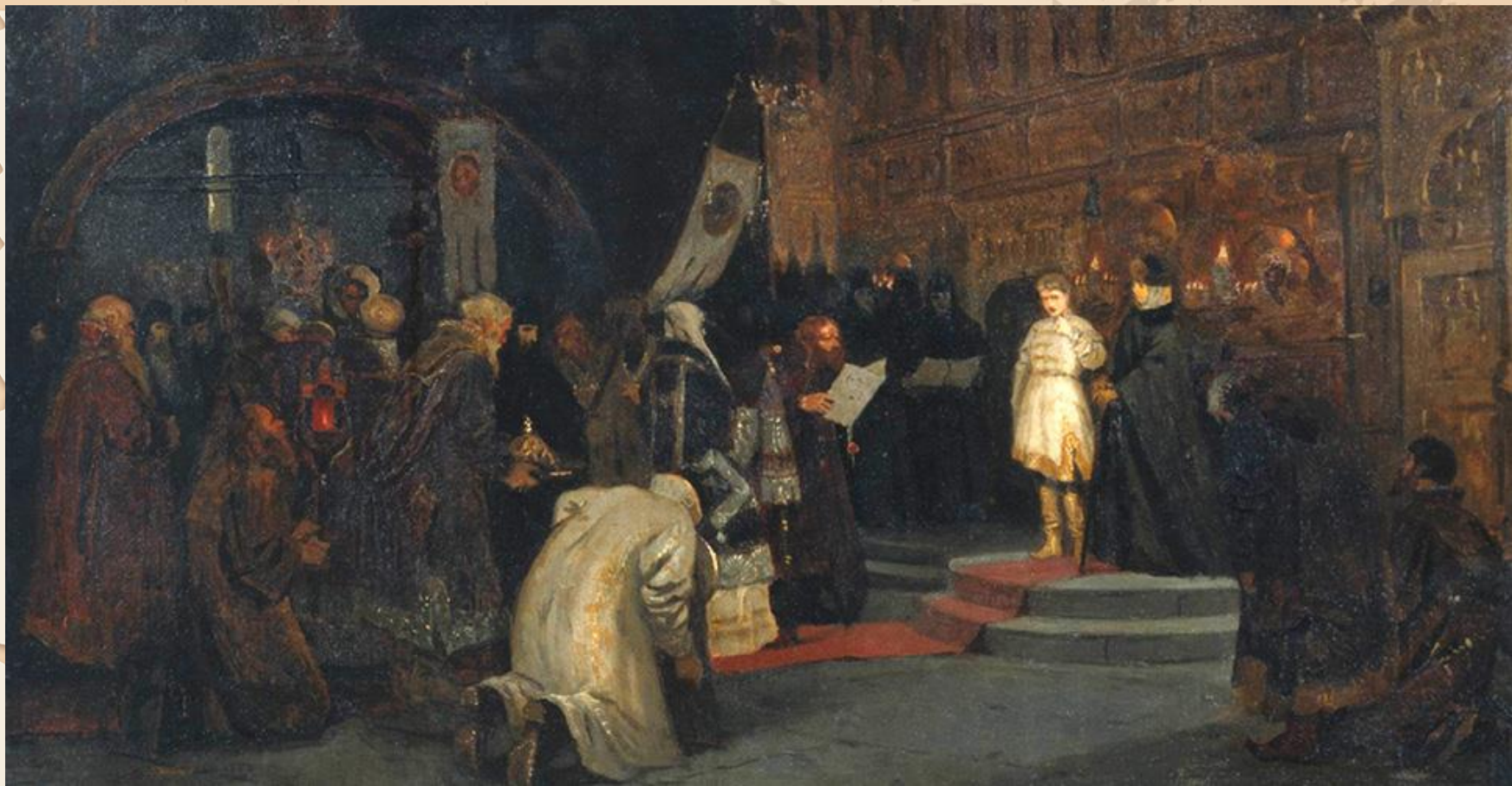
«Призвание Михаила Федоровича на царство (До государя челобитчики)» Михаил Нестеров 1885 г.