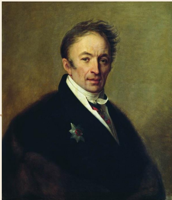
Николай Михайлович Карамзин

«Отец Михаила Романова, Филарет, был патриархом в Тушинском дворе и пользовался там большим уважением. Во многом благодаря этому факту Михаила поддерживали казаки и духовенство» Карамзин