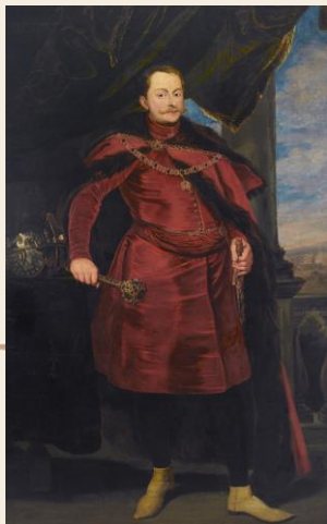
Сын польского короля Владислав

Около двух месяцев обсуждался вопрос о выборе нового царя.