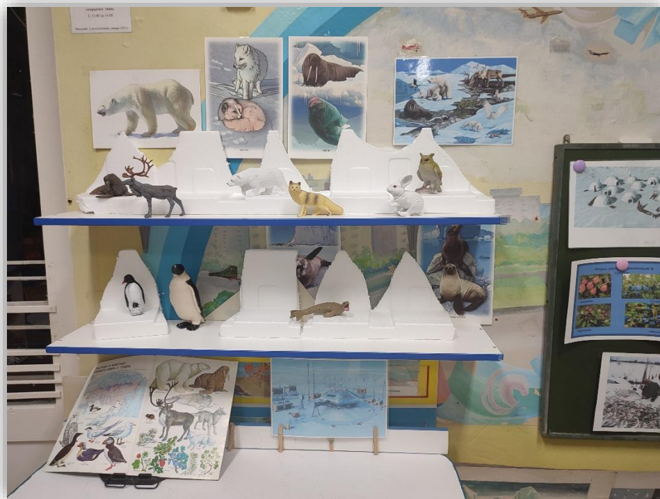
иллюстрации о жизни народов Крайнего севера