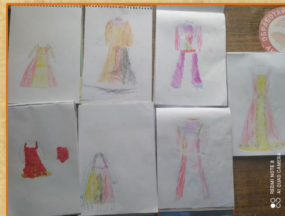
Рисование «Женский русский народный костюм»