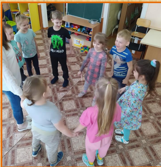
Р/народная игра: «Зоря, зарница»