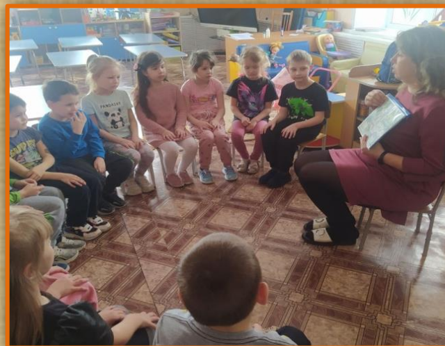
Беседа «Сравнение русской избы с современными домами»