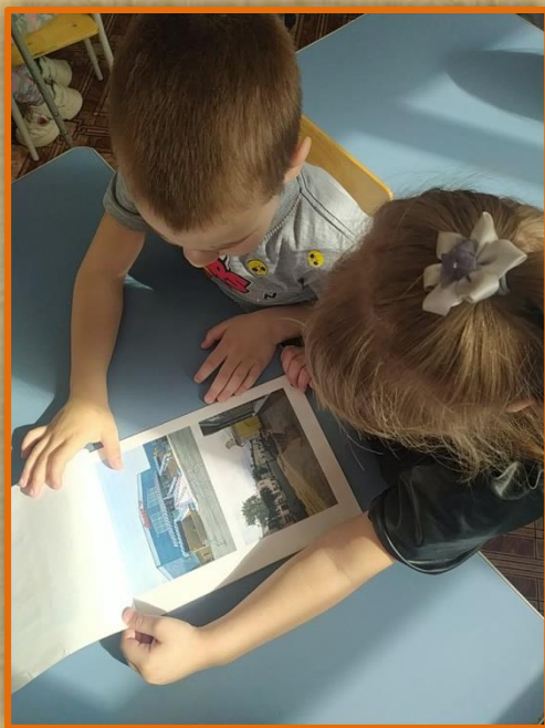
Рассматривание альбома «Мой родной город - Сергач»