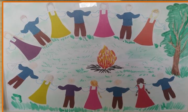
Аппликация на тему : «Радужный хоровод»