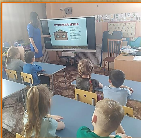
Презентация «Русская изба»