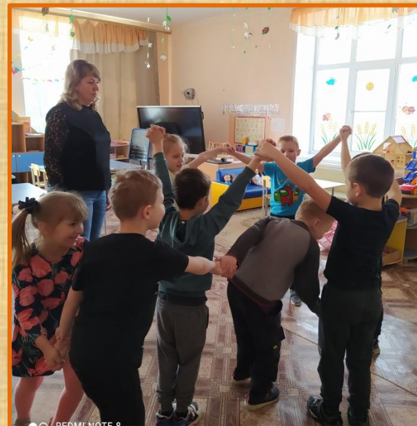
Р/народная игра: «Золотые ворота»