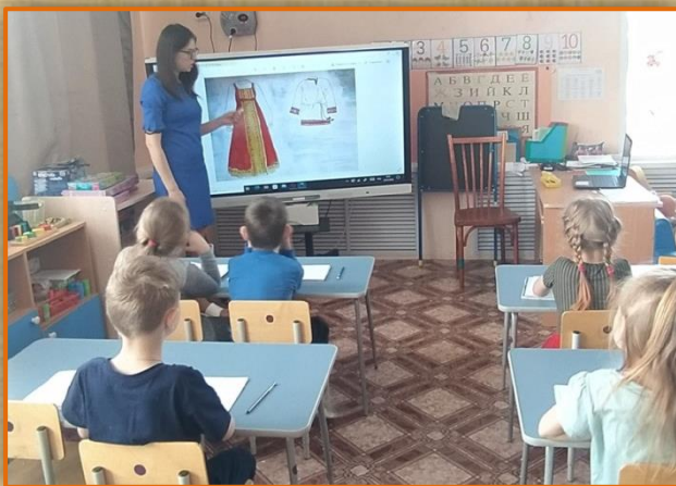
Презентация «Женская, мужская русские народные костюмы»