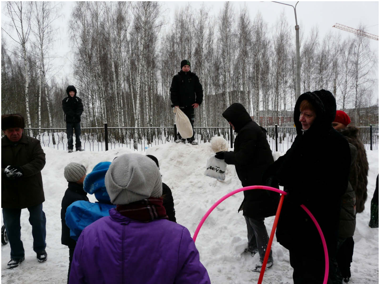
«Масленица». Проводы Русской Зимы.