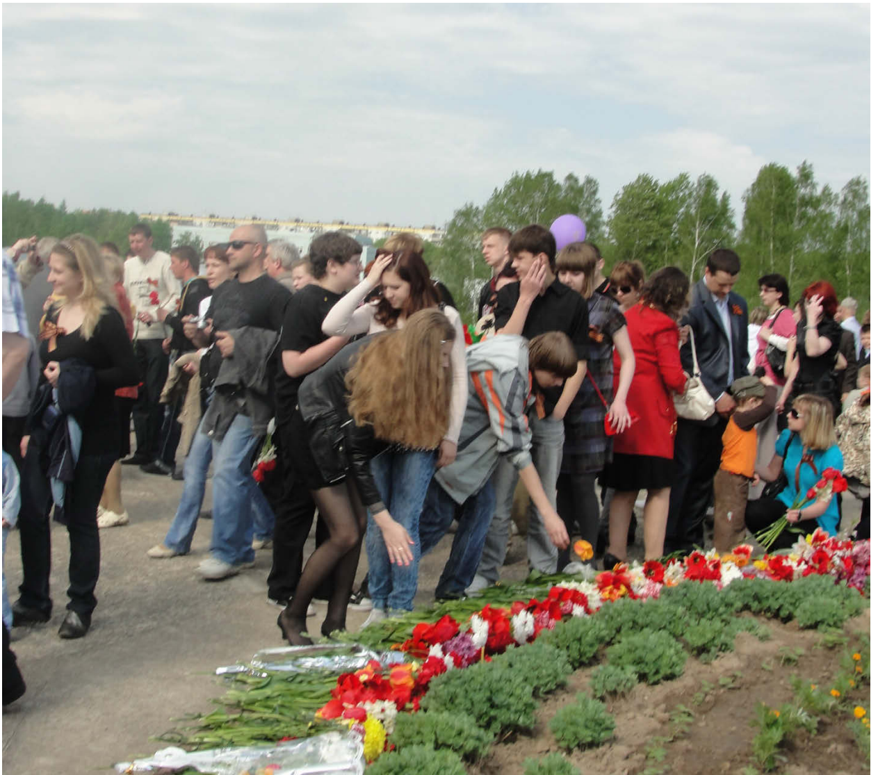
Возложение венков 9мая.