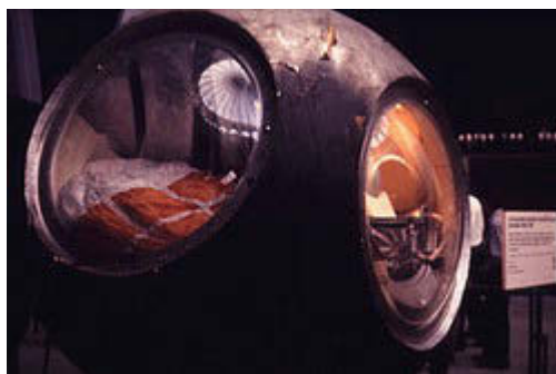
Спускаемый аппарат космического корабля "Восток" в Мемориальном музее космонавтики (г. Москва)