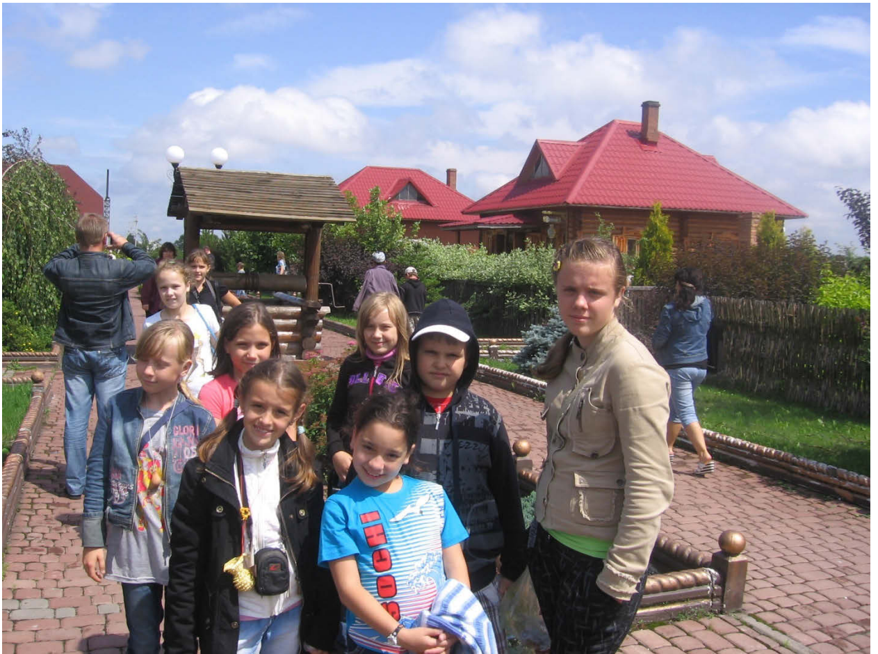
Экскурсия в Беларусь, город мастеров.