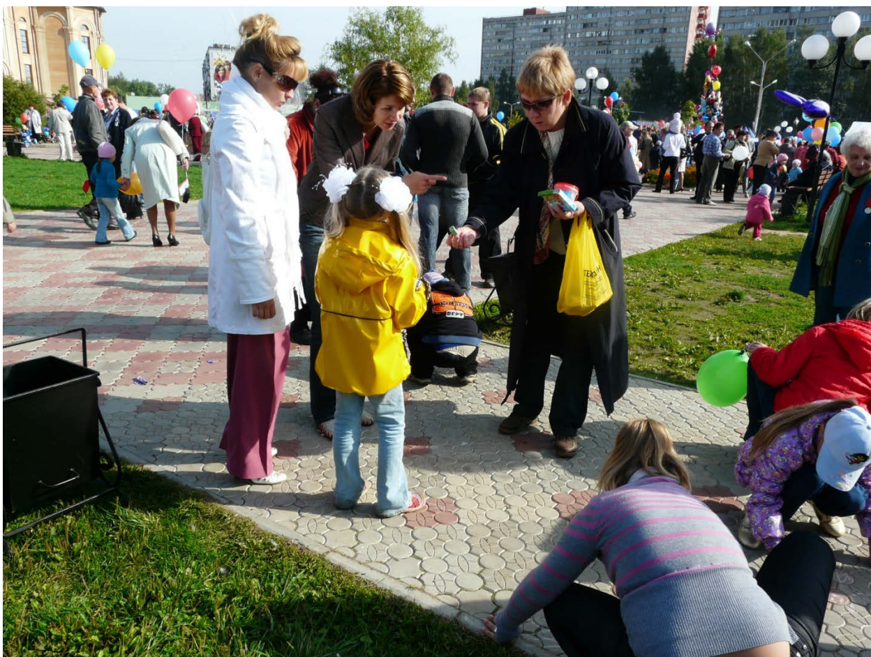
Праздник – «Рисунка на асфальте».