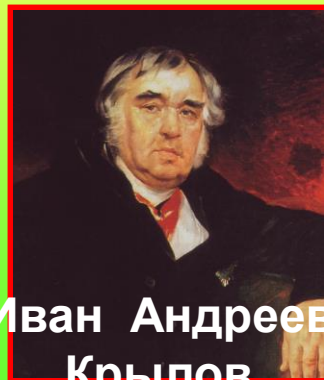
Иван Андреевич Крылов