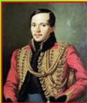
Михаил Юрьевич Лермонтов