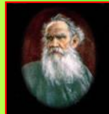
Лев Николаевич Толстой