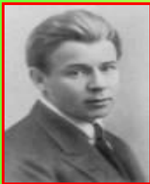
Сергей Александрович Есенин

Каких писателей ты знаешь? Запишите фамилию, имя и отчество нескольких известных писателей.