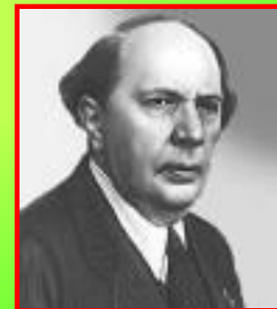
Алексей Николаевич Толстой