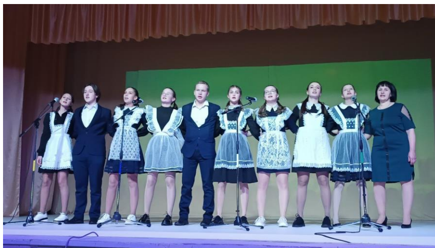
Выступление учащихся 11 класса с песней «Моя Россия» музыка и слова: Shaman