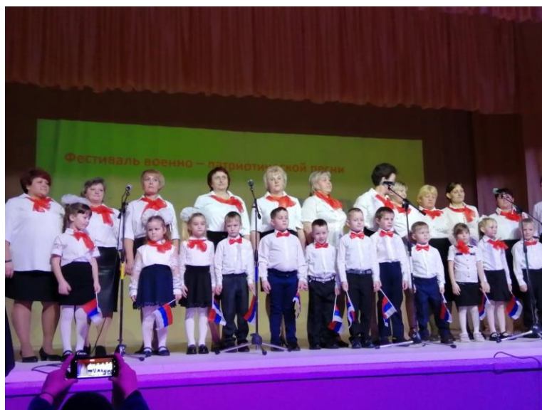
Коллектив детского сада «Земляничка»