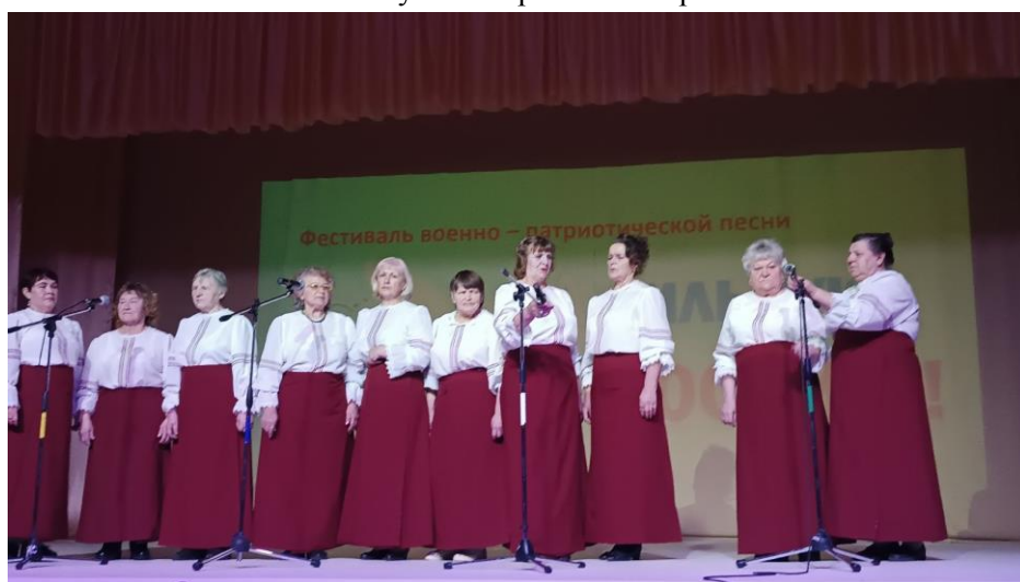
Гости фестиваля вокальный ансамбль «Сударушка»