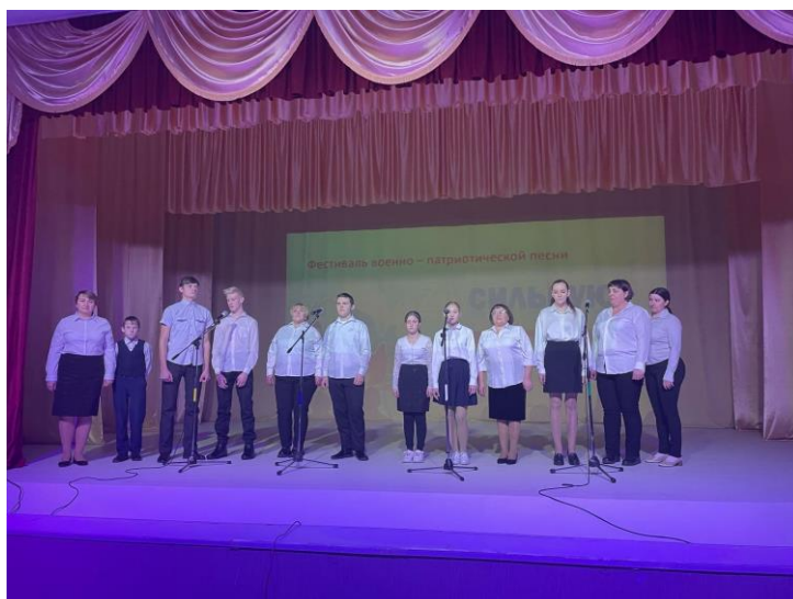
Выступление учащихся 7-9 «Б» (коррекционного класса) с родителями