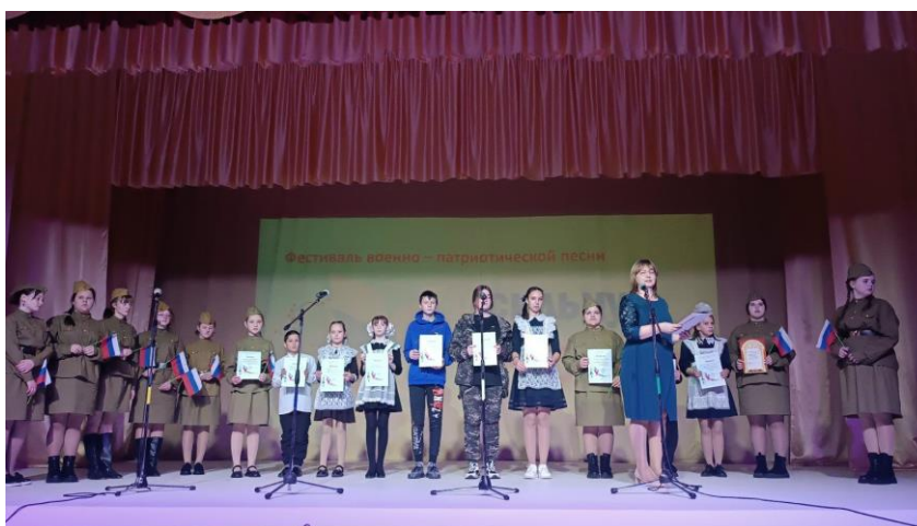
Награждение участников фестиваля