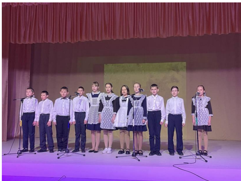
Выступление учащихся 5 класса