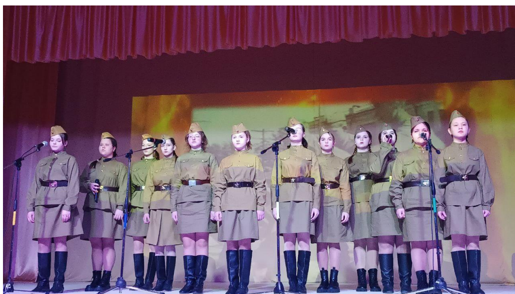
Выступление речевого хора