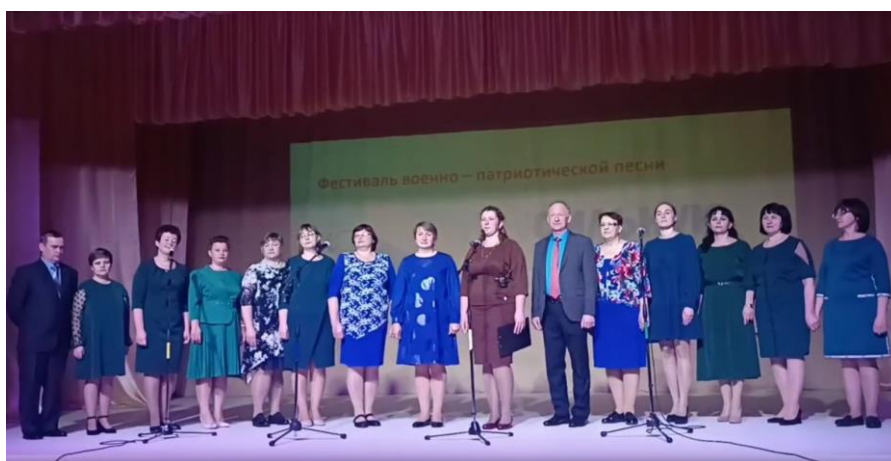
Хор педагогов Центра образования «Карзей»