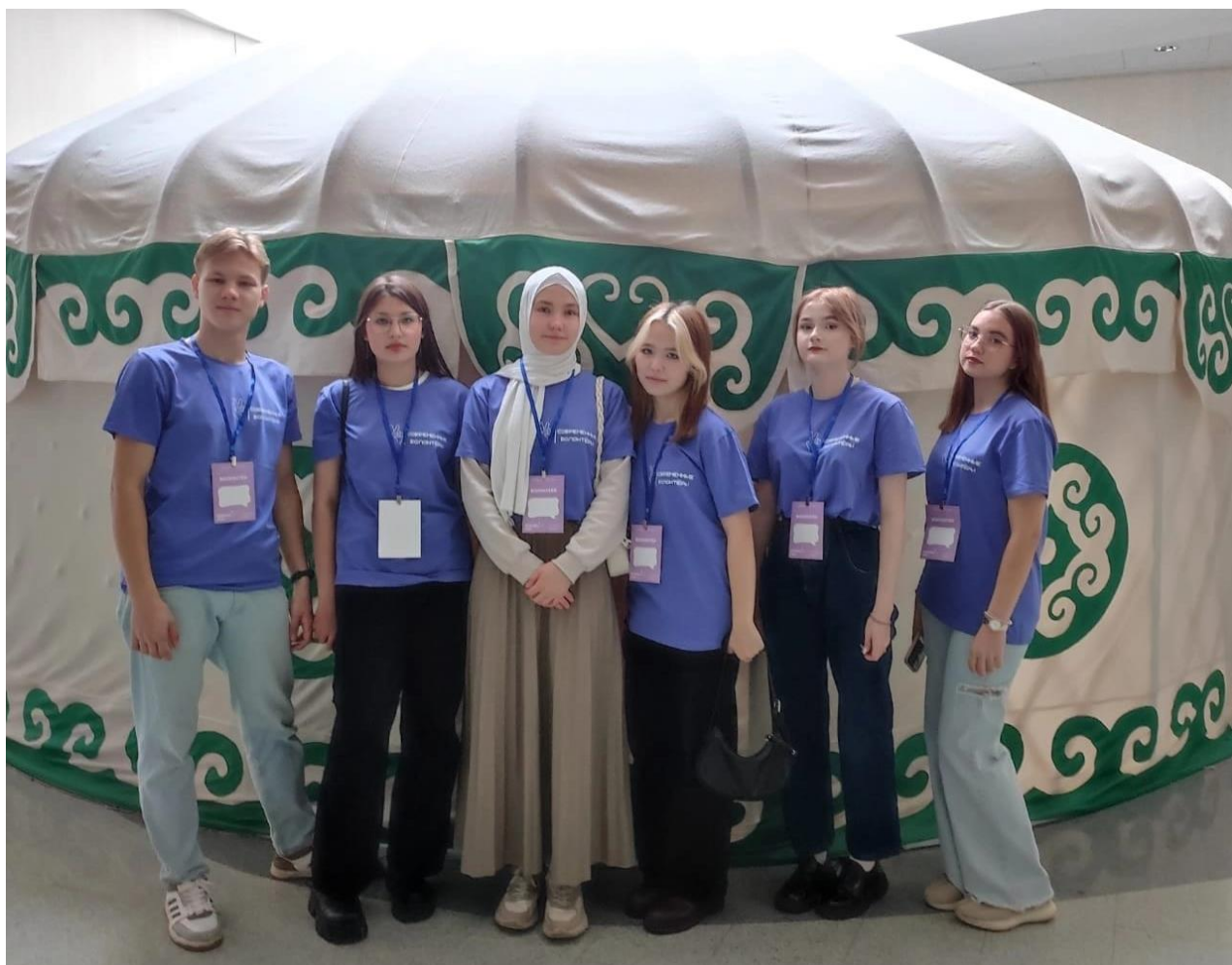
Участие во всемирном дне чистоты