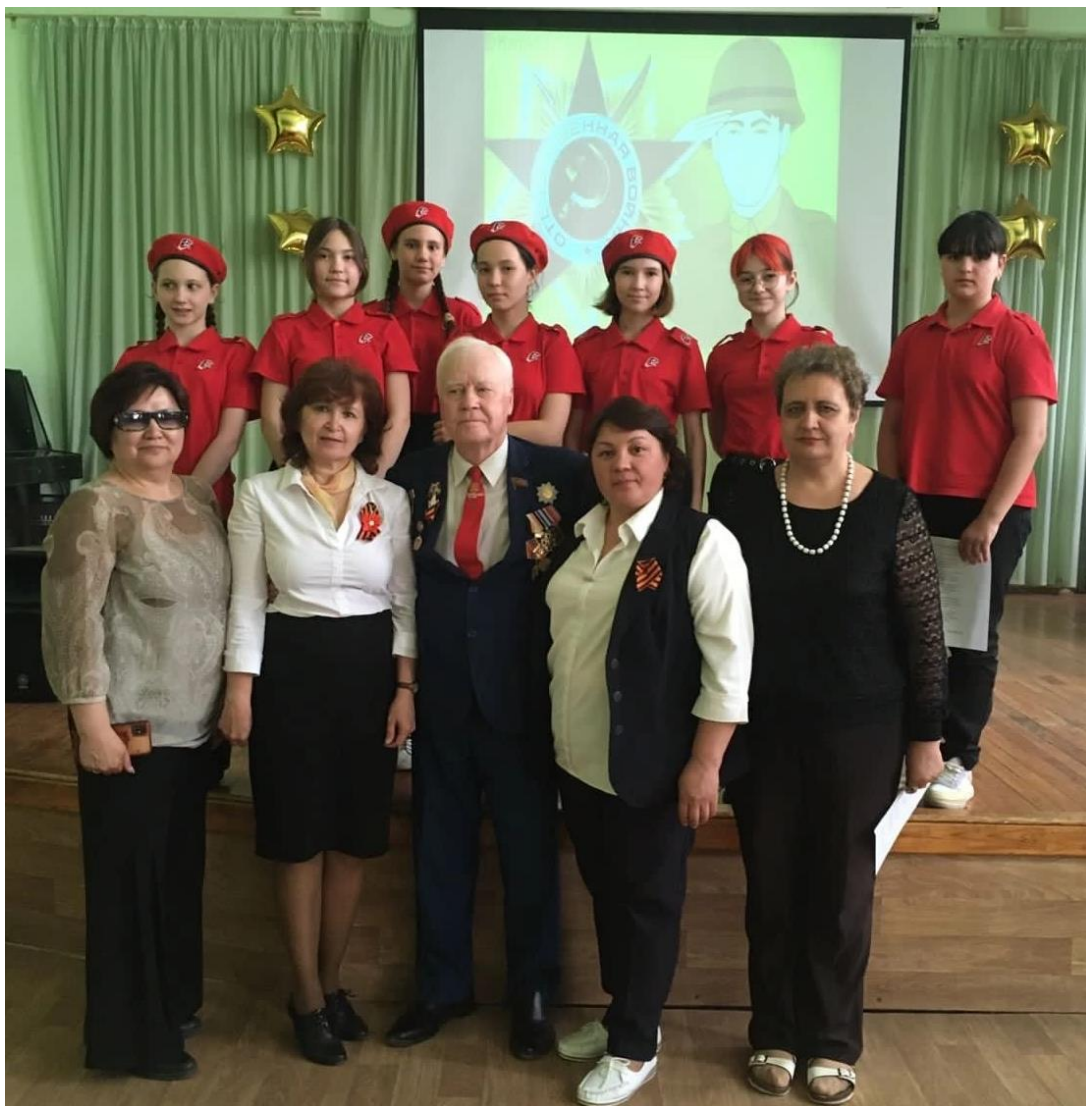
Мероприятие, посвященное Дню Победы