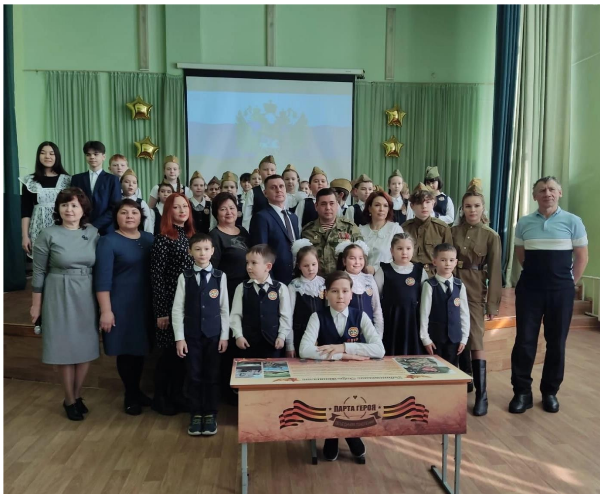
Открытие Парты Героя