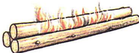
Нодья (таежный ночной)