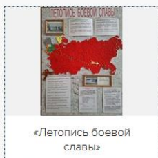
«Летопись боевой славы»