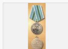
«Остались молодыми навсегда»