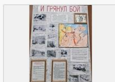
«И грянул бой»