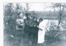
«По ним сверяем жизнь»