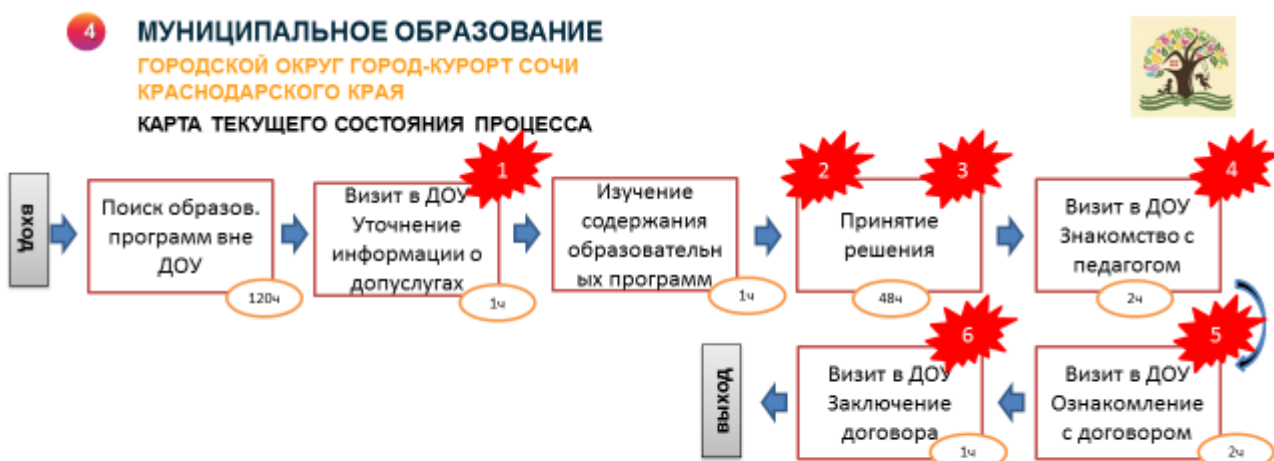
Рис.1. Текущее состояние

ВПП (время протекания процесса) составляет более 7 дней. Проблемы, с которыми столкнулись участники процесса: