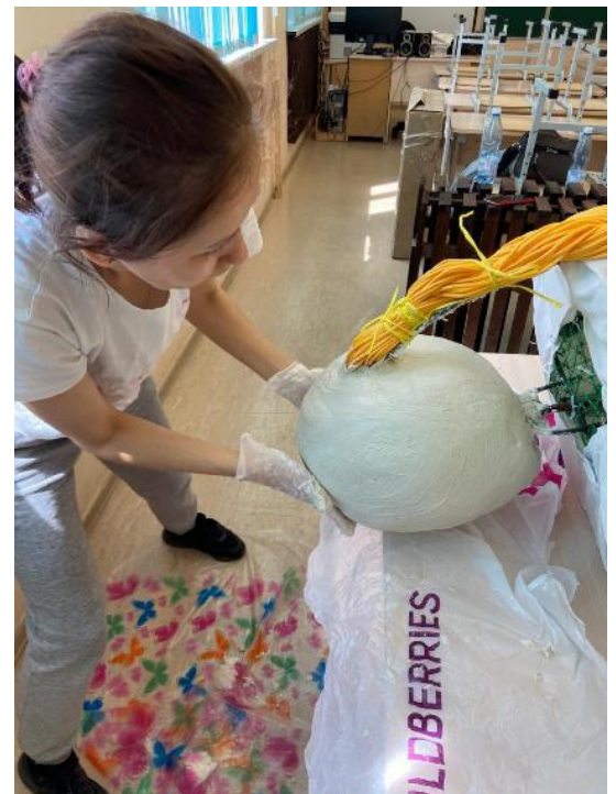
Присоединение косы к голове

Затем родители начали делать выкройку платья. Материал – плащевка. Ткань была выбрана влагоустойчивая.