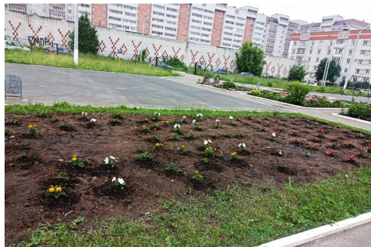
Первые посадки саженцев.