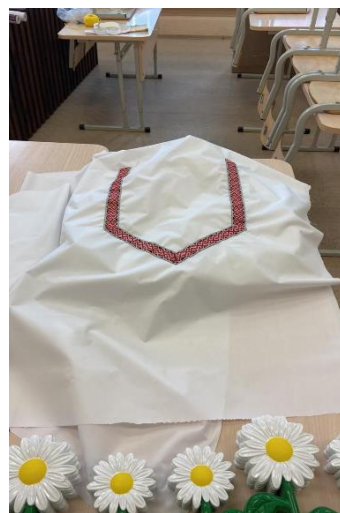
Этапы изготовления костюма

Платье украсили тесьмой с марийской вышивкой. Затем детали костюма: спинка, передняя часть, рукава и юбка - примеривались и сшивались прямо на конструкции нашей «красавицы».