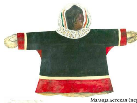
Малица детская (перед)

Летняя мужская одежда по покрою не отличается от зимней. В качестве летней одежды служат старые малицы или суконные гуси.