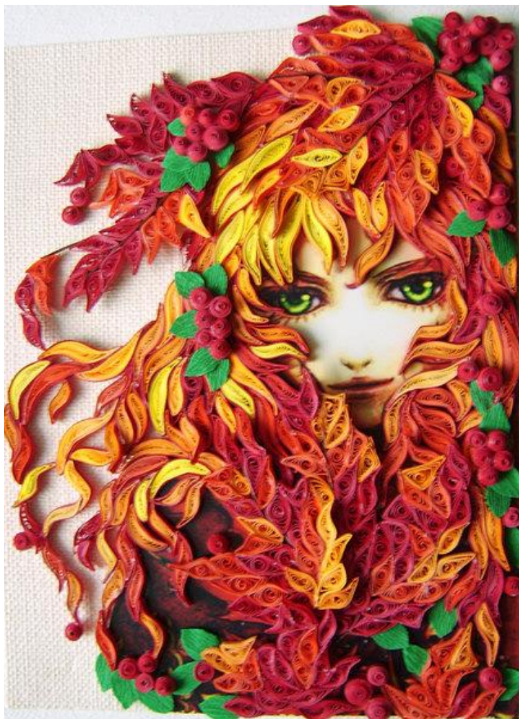
«Объемный квиллинг» – модное и красивое хобби.

Что же представляет собой эта техника? Перевод слова звучит как острое птичье перо. Если заглянуть в историю его возникновения, то можно понять, почему такое странное название присуще этой технике. Еще во времена средневековья монахини на досуге развлекали себя изготовлением бумажных медальонов из бумаги путем накручивания ее на кончики птичьих перьев. Сквозь века данное творчество не только не потеряло своей актуальности, но и наоборот обогатилось множествами интересными приемами в работе.