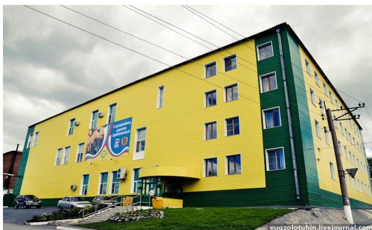
Рисунок 2 – «Подорожник»

Из учреждений культуры можно назвать местный исторический музей, две библиотеки, культурно-досуговый центр «Цементник» (рис.3), школу искусств и художественную школу. Из спортивных учреждений есть свой стадион, бассейн, много спортивных площадок.