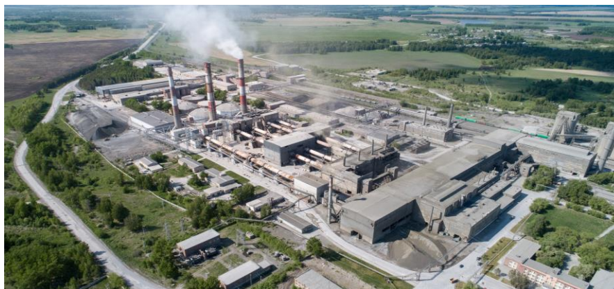
Рисунок 1 – Топкинский цементный завод

Градообразующим предприятием остается Топкинский цементный завод, который сейчас называется АО «Холдинговая компания «Сибирский цемент» (рис.1). Предприятие производит в год до 3 миллионов тонн цемента, при этом входит в пятёрку крупнейших производителей цемента России и является лидером на рынке строительных материалов в Сибири.