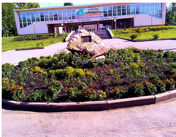
Рисунок 3 – Культурно-досуговый центр «Цементник»

Из учреждений культуры можно назвать местный исторический музей, две библиотеки, культурно-досуговый центр «Цементник» (рис.3), школу искусств и художественную школу. Из спортивных учреждений есть свой стадион, бассейн, много спортивных площадок.