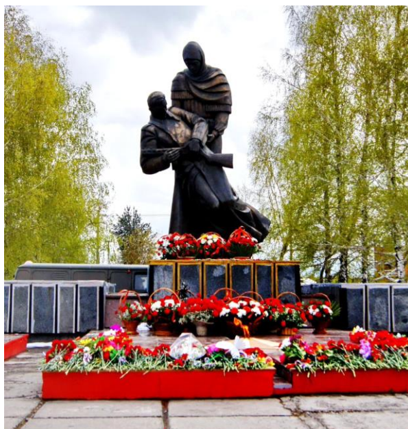
Рисунок 5 – Родина-Мать