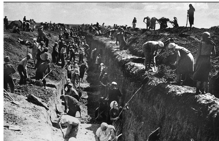
Школьники и домохозяйки рыли окопы и противотанковые рвы

28 героев Панфиловцев в течение четырех часов под шквальным огнем артиллерии и бомбежками с воздуха сдерживали танки и пехоту врага. Они отразили несколько атак противника и уничтожили 18 танков из 50.