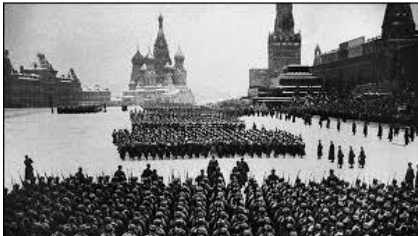
Военный парад на Красной площади 7 ноября 1941 года

Битва за Москву стала одной из самых кровопролитных в ходе Великой Отечественной войны. Войска гитлеровской Германии, развернув 30 сентября 1941 г. операцию «Тайфун», сумели вплотную подойти к советской столице, но так и не сумели ее взять. В ходе битвы вермахт понес первое сокрушительное поражение в ходе Второй мировой войны.