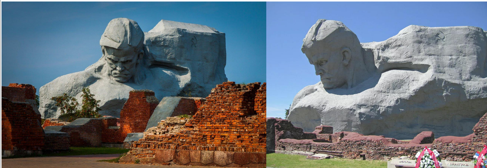
Монумент "Мужество" мемориального комплекса "Брестская крепость-герой"

22 июня 1941 г. после продолжительной артиллерийской подготовки, в 4.00 утра германские войска атаковали советско-германскую границу на всем ее протяжении от Баренцева до Черного морей.