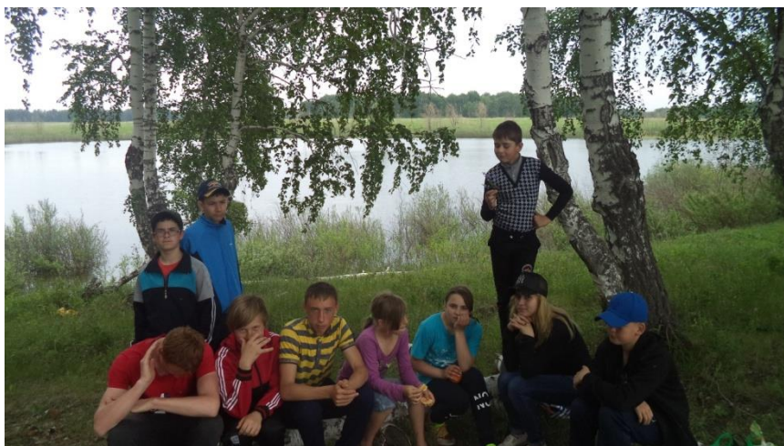
Экскурсия профильной смены «Память деревне» по шемонаевским прудам