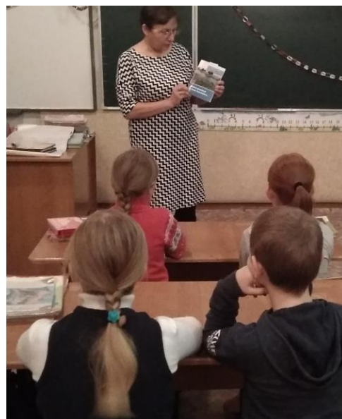
Выступление перед школьниками со сборником