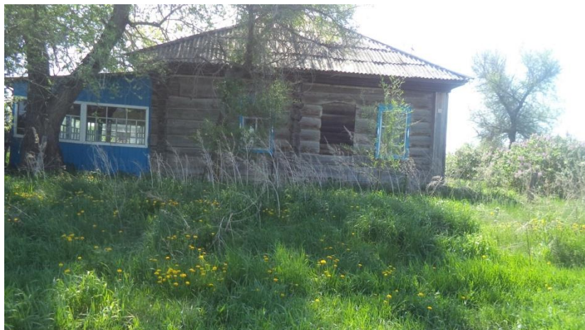
Здание Киевской начальной школы, сейчас пустующий дом в Верх-Пайве