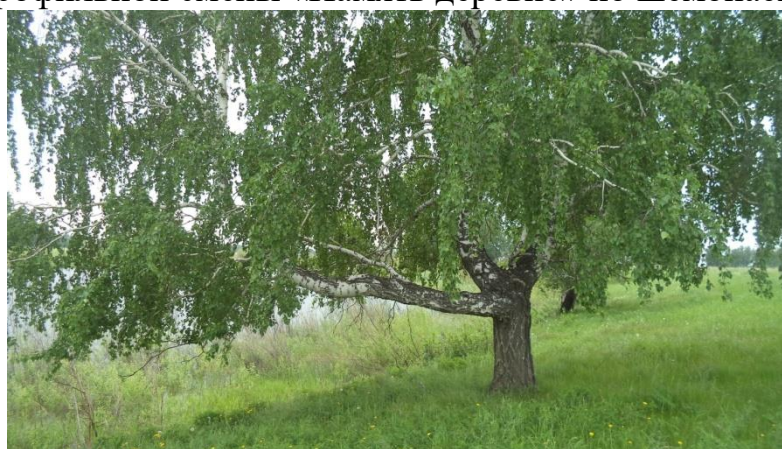
Трёхствольных берёз в Шемонаевке много