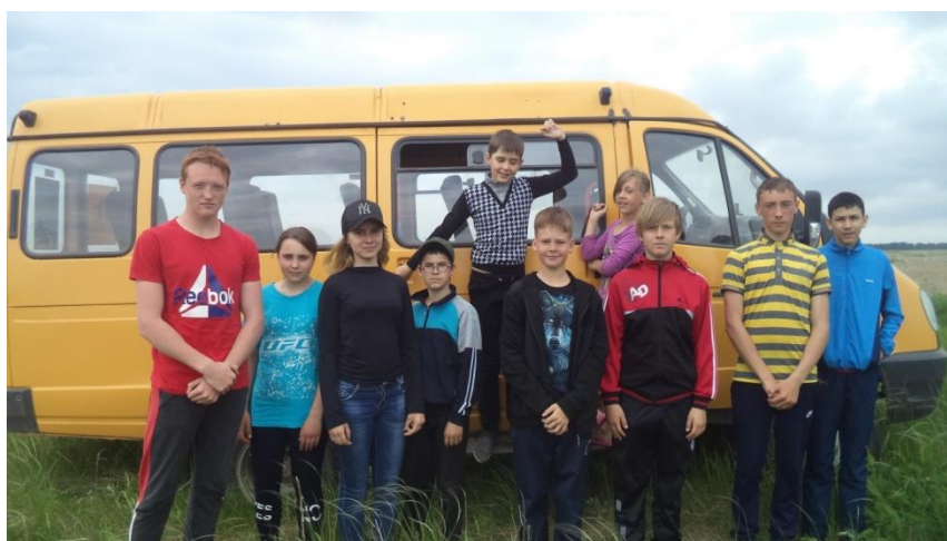
На самарском пруду