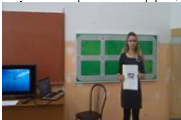
Выступление на окружной конференции (г.Камень-на-Оби)