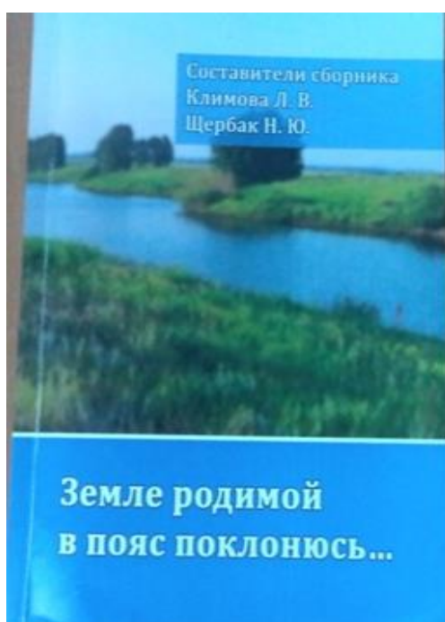
Сборник «Земле родимой в пояс поклонюсь...»