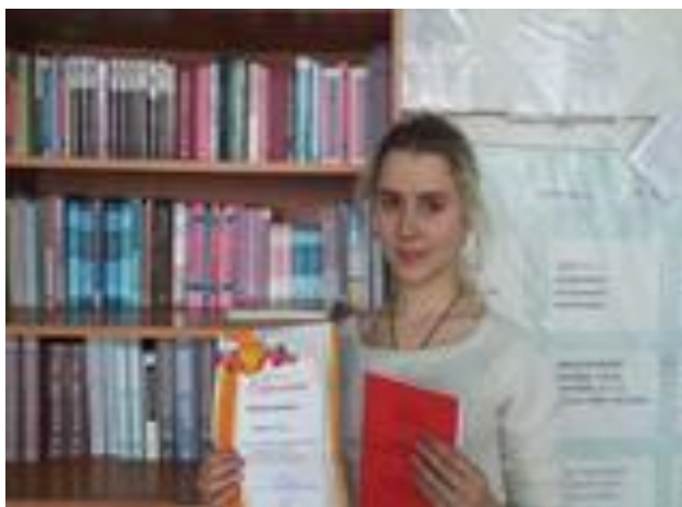
Выступление на районной конференции