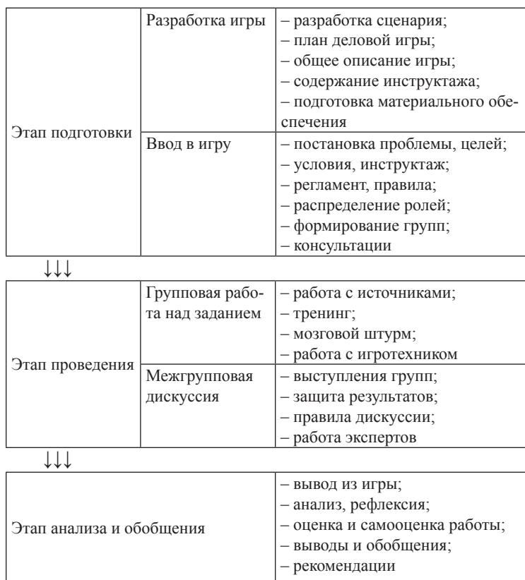
Рис. 2. Технологическая схема деловой игры

Технология деловой игры состоит из нескольких этапов (рис. 2).