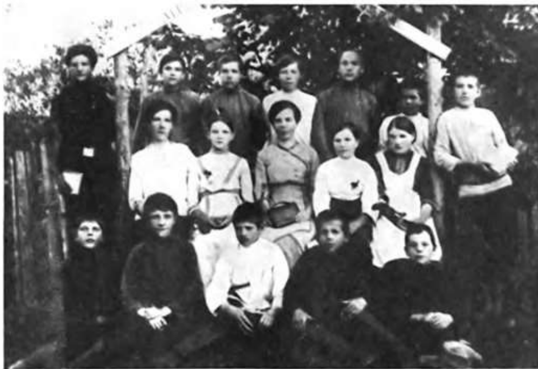
Сёстры Меньшиковы с учениками. Фотография 1913 г.