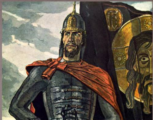
П. Корин. Александр Невский.