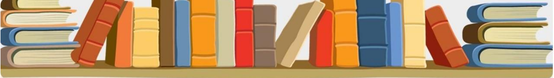
Создание «Буктрейлера» по сказке «Репка»