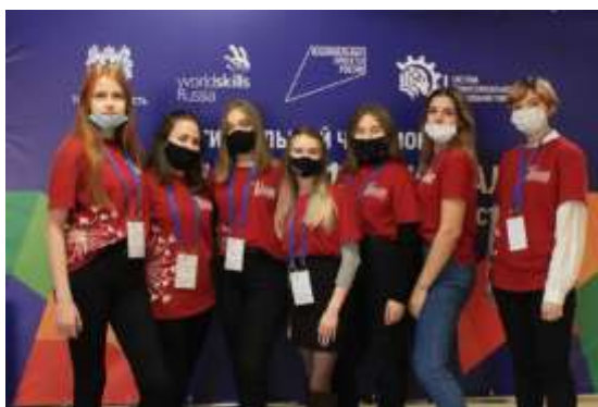
Рисунок 2. Форма ССУ

Для членов Студенческого совета имеется фирменная форма (футболки и кепки)