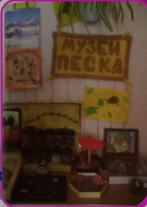
Мини-музей «Волшебный песок»