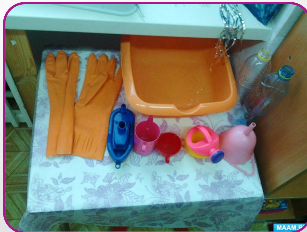
Подраздел «Вода в быту»