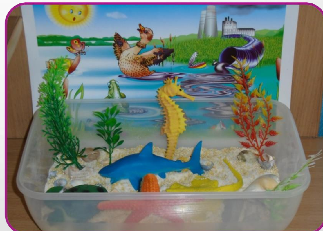
Раздел « Жизнь в воде»