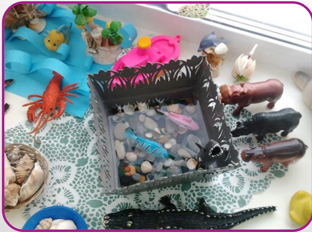
Подраздел «Вода в жизни животных и растений»