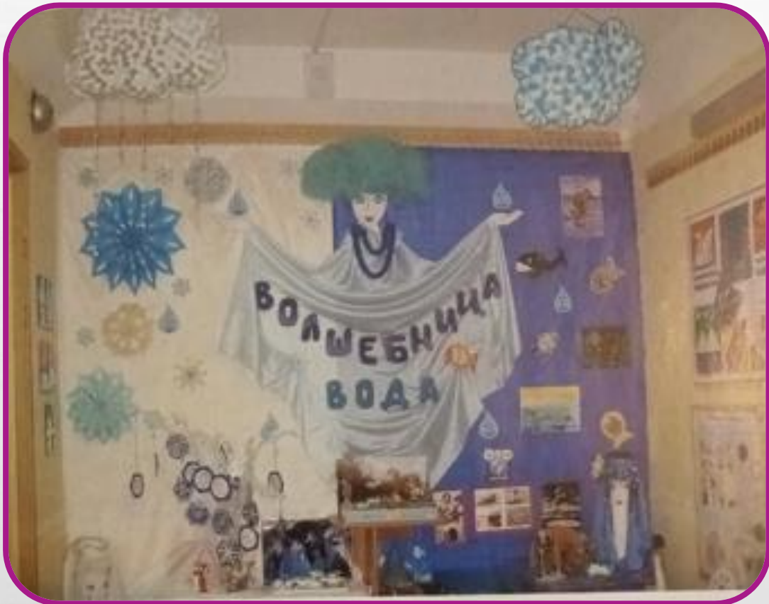
Мини-музей «Волшебница вода»