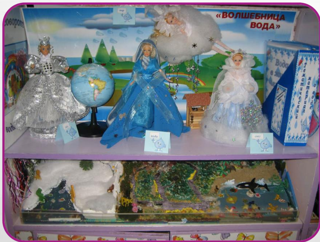
Раздел « Вода в природе»