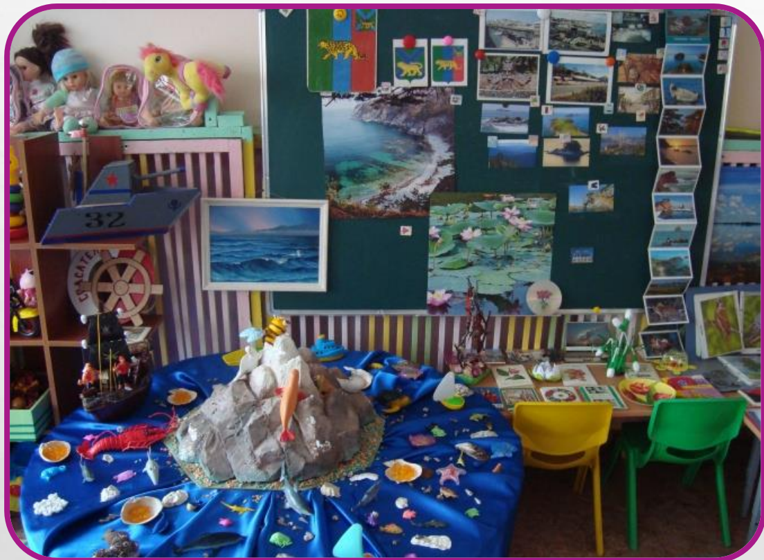
Подраздел «Вода в гербах»