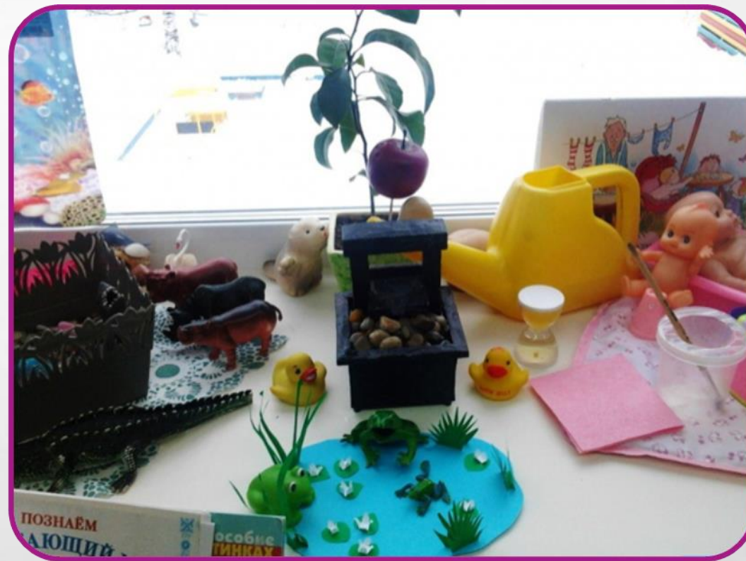
Раздел «Вода в жизни человека»