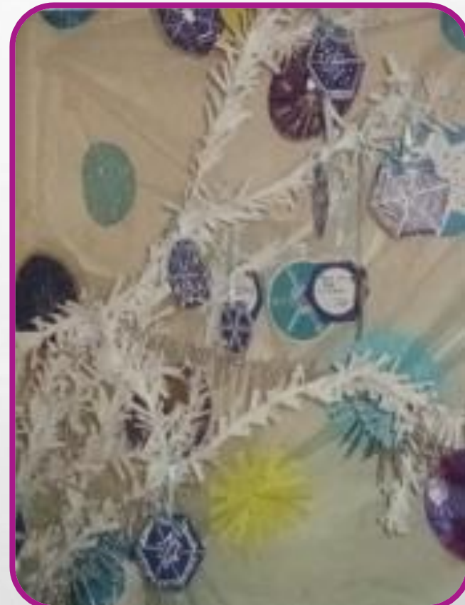
Уголок загадок в мини – музее «Волшебница вода»