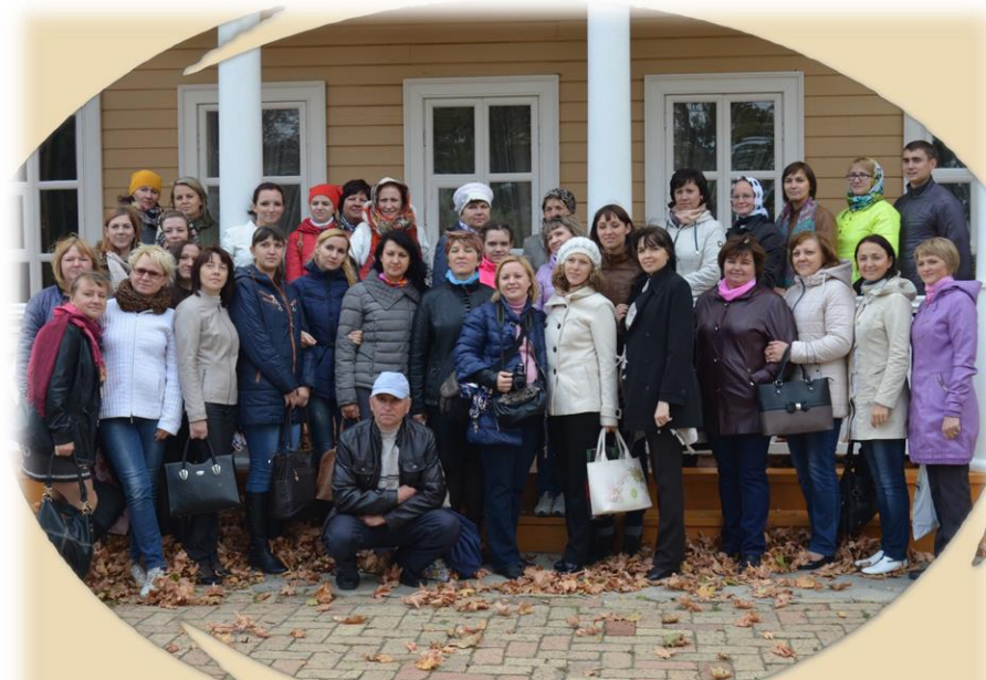
Коллектив детского сада "Лукоморье" в Тарханах