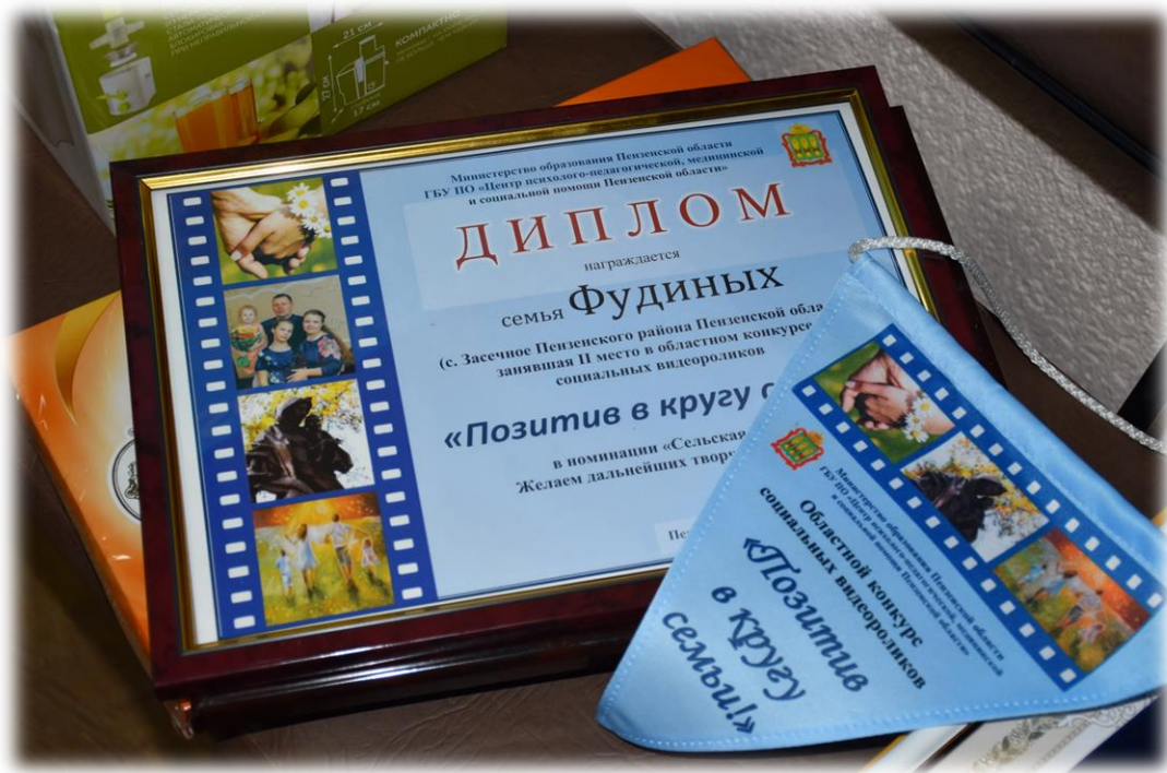
Участники конкурса «Позитив в кругу семьи»