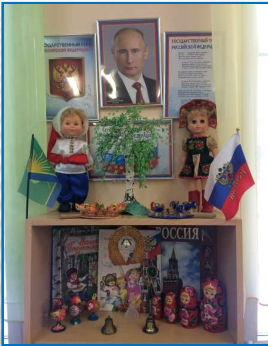
✕ «Наша страна Россия» (символика)