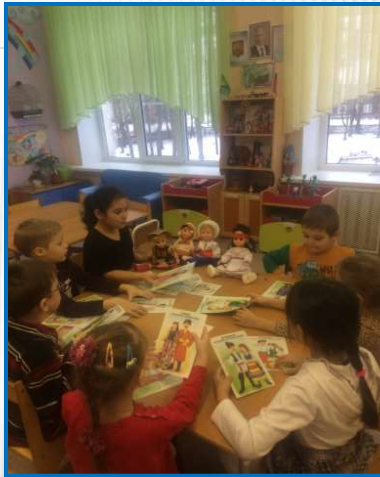
✦ Настольная игра «Национальный КОСТЮМ»