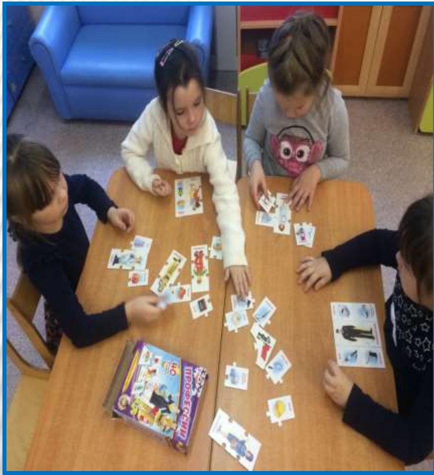
✦ Настольная игра «Профессии»