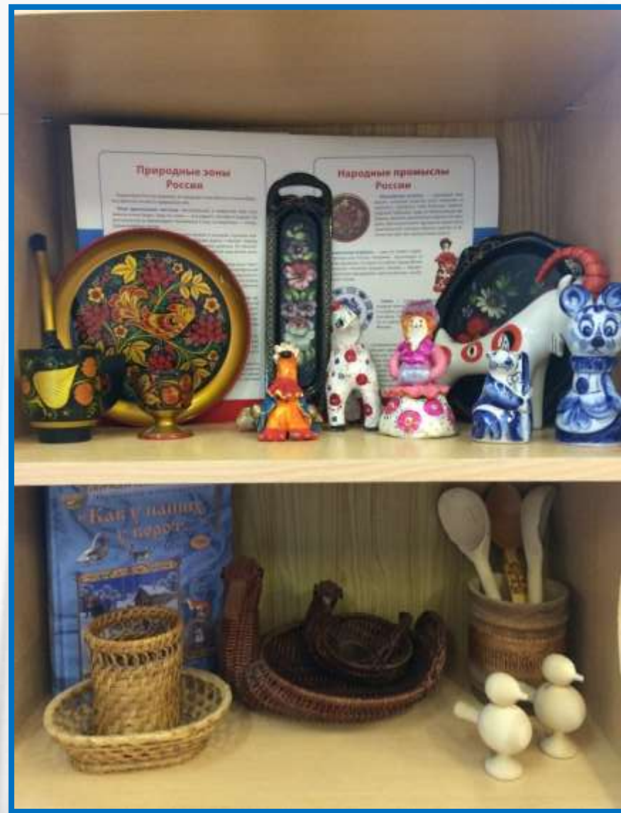
✕ Народные промыслы