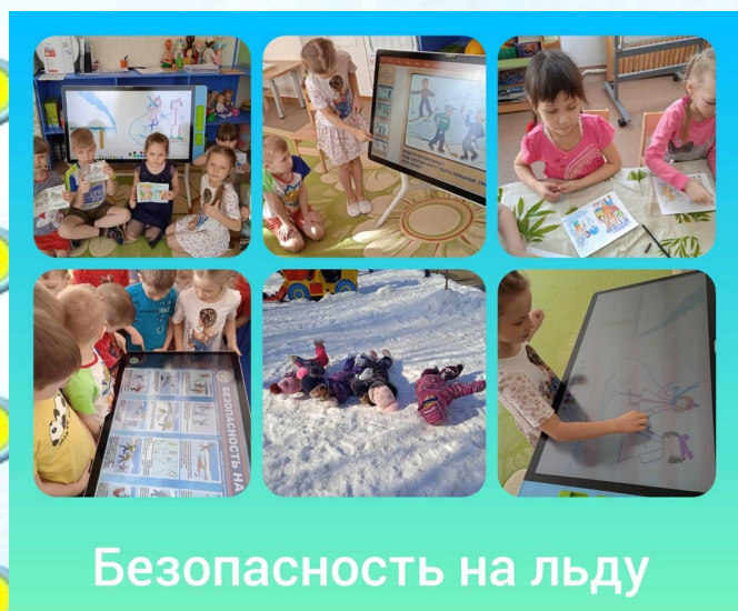
Безопасность на льду