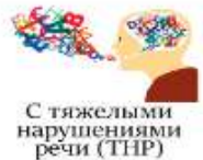
С тяжелыми нарушениями речи (ТНР)