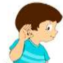
Слабослышащие и позднооглохшие

Индивидуальные и групповые логопедические дефектологические занятия Развитие пространственно-временных представлений