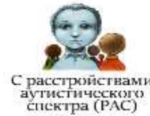
С расстройствами аутистического спектра (РАС)