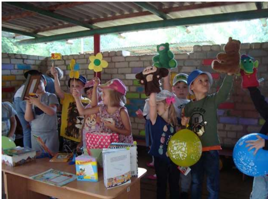
Конкурс чтецов «Земле родной я с детства благодарен...», (в рамках мероприятий, посвященных 85-летию юбилею смоленского поэта и писателя А.В. Мишина)