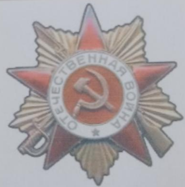
Орден Отечественной войны