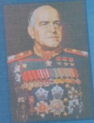
Георгий Константинович Жуков (1896-1974)

Главные черты таланта Георгия Жукова — творчество, инициативность, умение принимать нестандартные решения, умение находить слабые места противника и использовать их в свою пользу. Также глубокая проницательность, умение предвидеть развитие событий. Жуков — блестящий полководец, способный в любой обстановке сыграть важную роль. Его участие в обороне Москвы, Сталинграда и в наступлении на Берлин — это блестящие примеры его таланта. Жуков — один из немногих полководцев, способных сыграть важную роль в истории. Его стратегические решения и тактика — это образец для подражания. Жуков — великий полководец, который сыграл важную роль в победе над фашизмом. Его имя навсегда останется в истории Великой Отечественной войны. Четырежды Герой Советского Союза, Маршал Советского Союза.