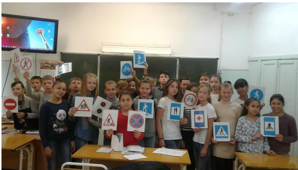
Отряд 6 а класса «Мы знаем ПДД»