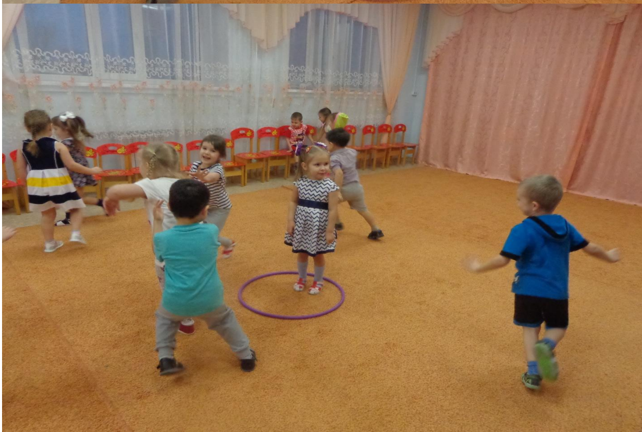
Подвижные игры: «Птички в гнёздышках», «Совушка-сова» (см. основной этап п.11)