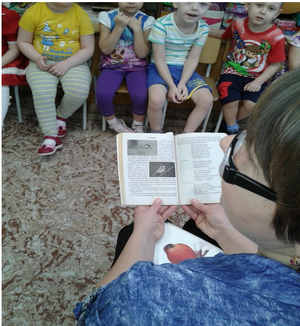
Чтение художественной литературы (см. основной этап п.4)