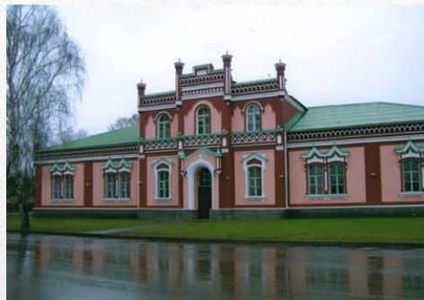
Детская школа искусств