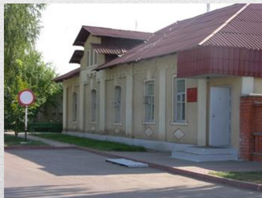
Здание районного комиссариата