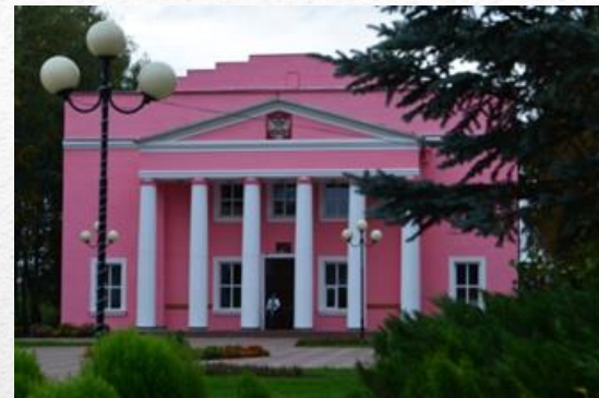
Здание районного Дома культуры