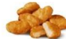
Чикен Макнаггетс (6 шт.)