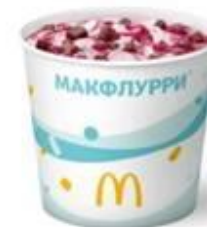
Макфлурри Вишневый пирог