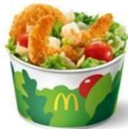
Салат Цезарь с креветками