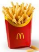
Картофель Фри Средняя порция