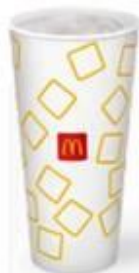
Молочный Коктейль Ванильный Большой