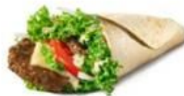
Биг Тейсти Ролл