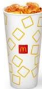
Липтон Айс Ти – Лимон Большой