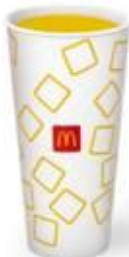
Апельсиновый сок Большой