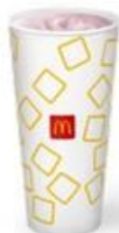
Молочный Коктейль Клубничный Большой