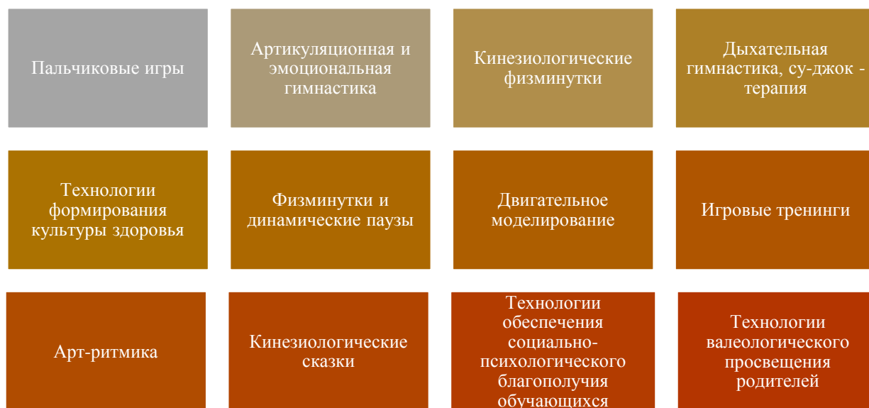
Рис.3. Здоровьесберегающие и развивающие технологии

В ходе реализации инновационного направления с 2019 года по настоящее время в школе успешно реализуются здоровьесберегающие и развивающие технологии (Рис.2).