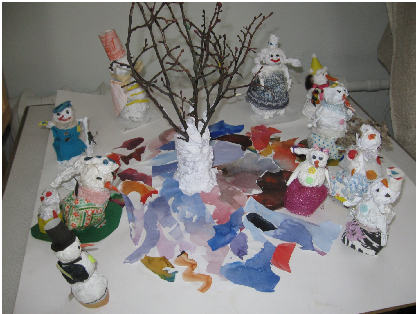
Применение аппликации из палитр в коллективной работе «Весенние снеговики»