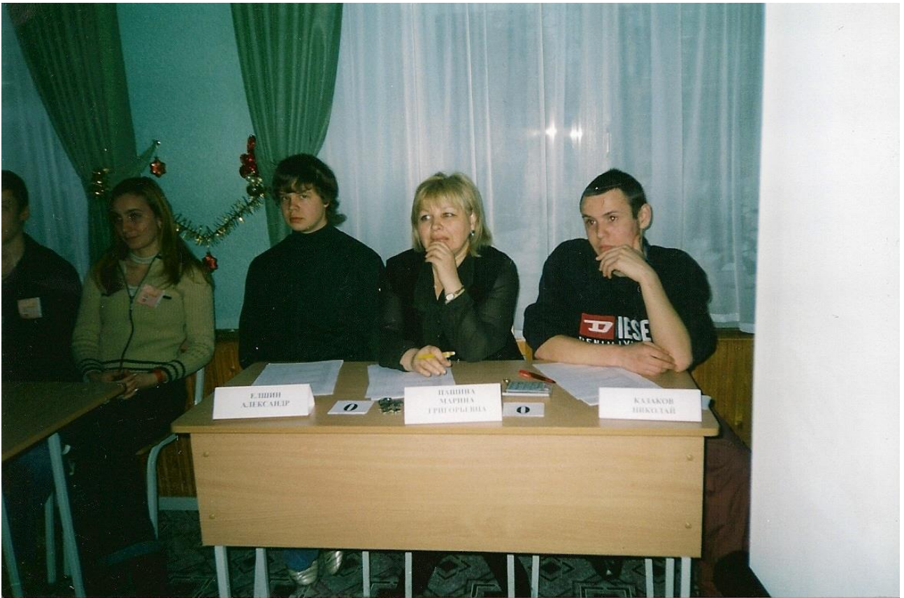
Ой, Жюри, жюри, Жюри, ты нас строго не суди!!!