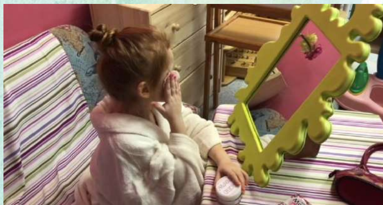
Очищение кожи косметическим средством