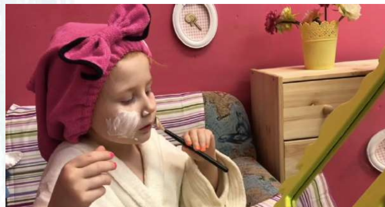
Очищение кожи маской