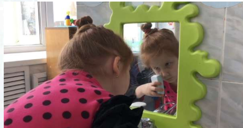
Умывание лица мылом